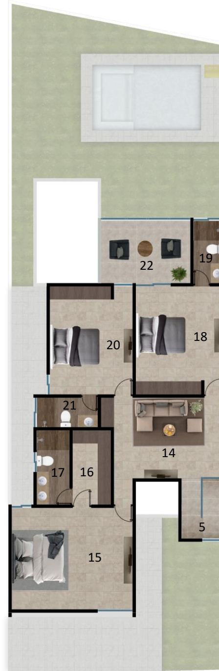
PLANTA ARQUITECTONICA PLANTA ALTA