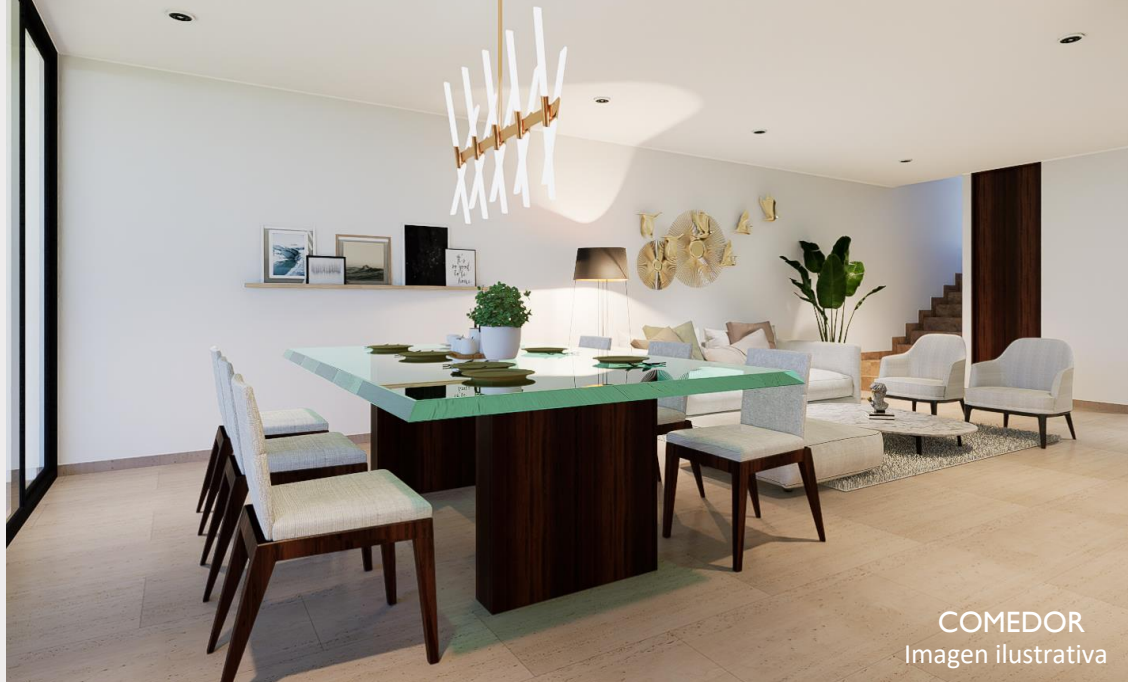
COMEDOR Imagen ilustrativa