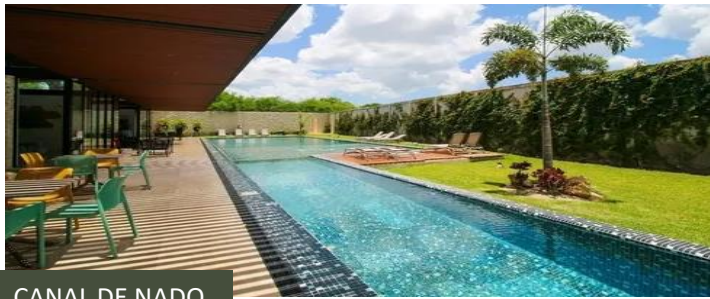
CANAL DE NADO