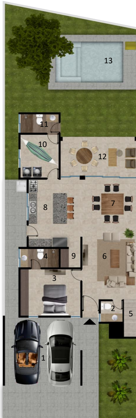
PLANTA ARQUITECTONICA PLANTA BAJA