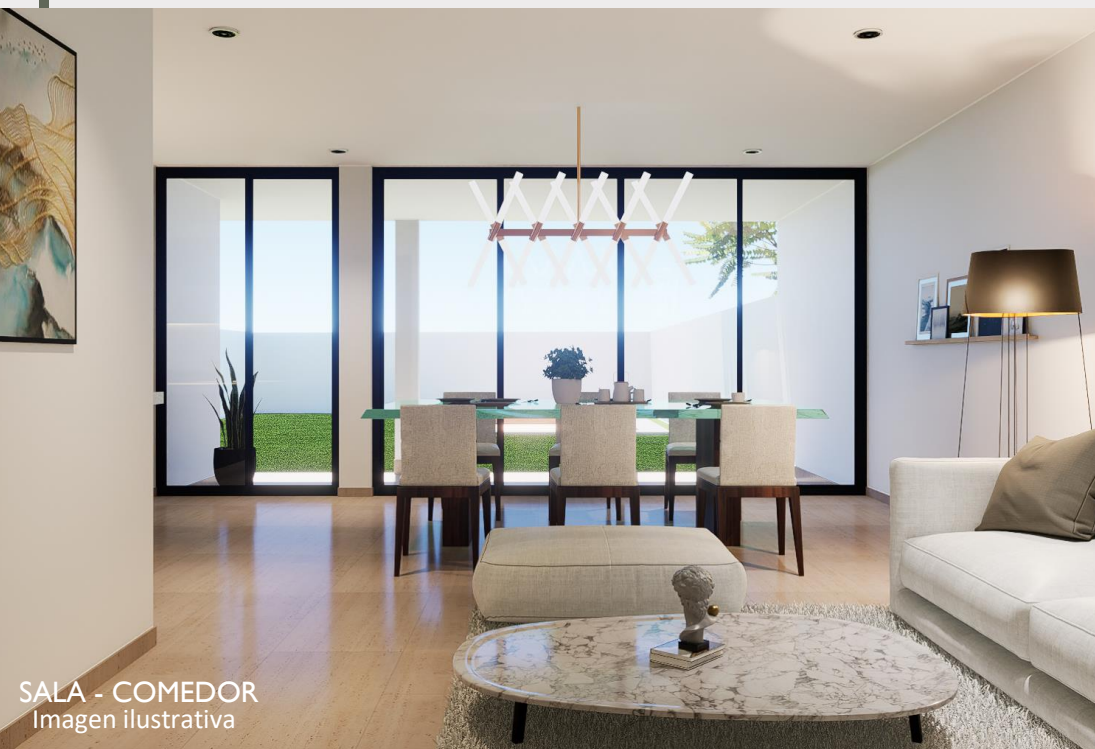
SALA - COMEDOR Imagen ilustrativa