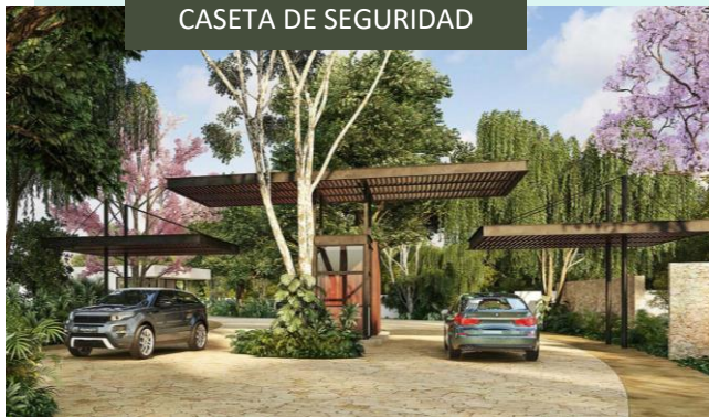
CASETA DE SEGURIDAD