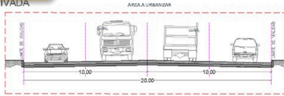
SECCION 02 VIALIDAD TIPO VIALIDAD LOCAL 20MTS VIALIDAD LOCAL 20 MTS VIALIDAD PRIVADA