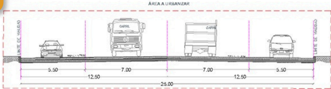
SECCION 01 VIALIDAD PRINCIPAL VIALIDAD LOCAL 25 MTS VIALIDAD PRIVADA LOCAL 25 MTS VIALIDAD PRIVADA