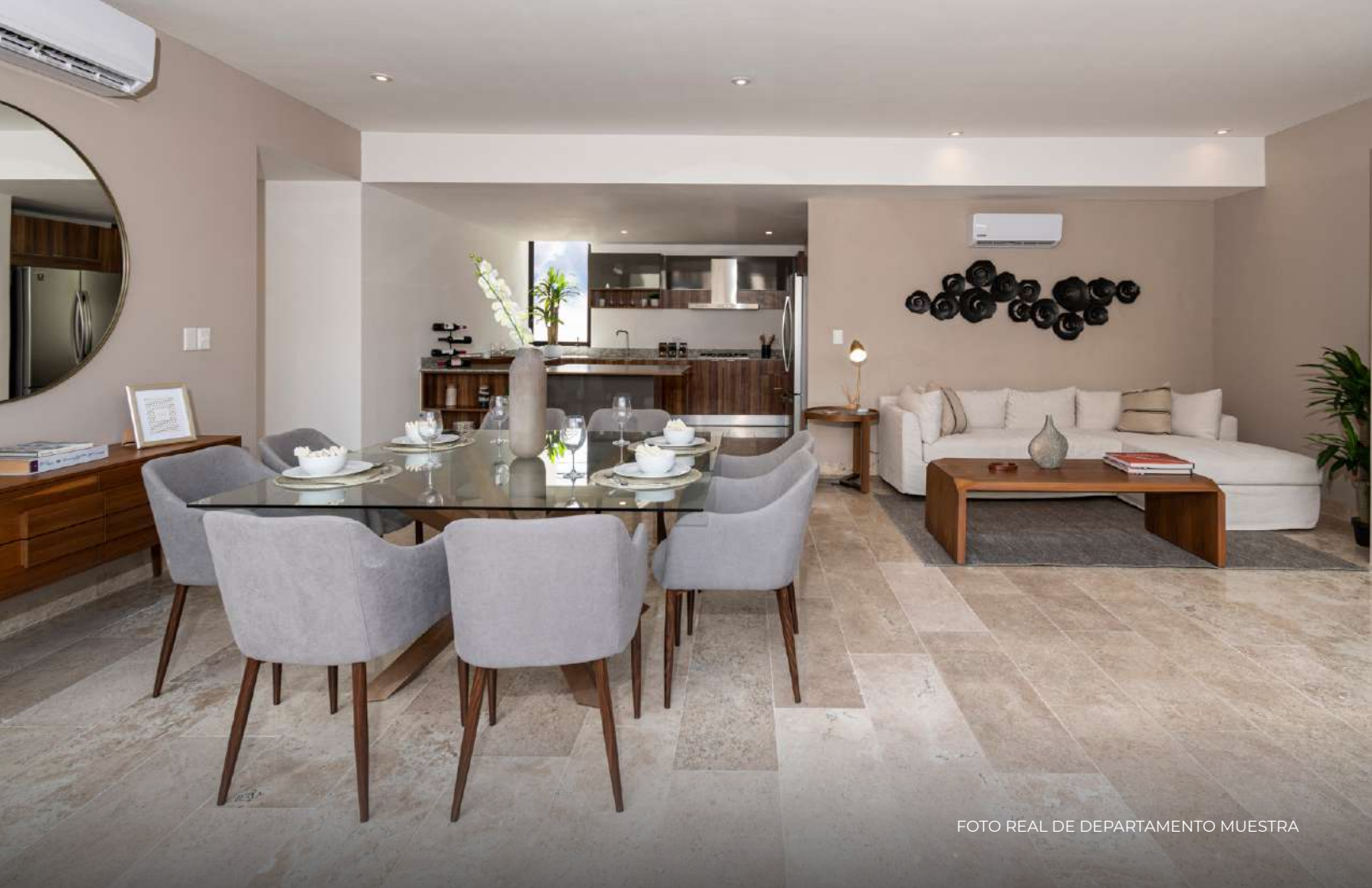
FOTO REAL DE DEPARTAMENTO MUESTRA