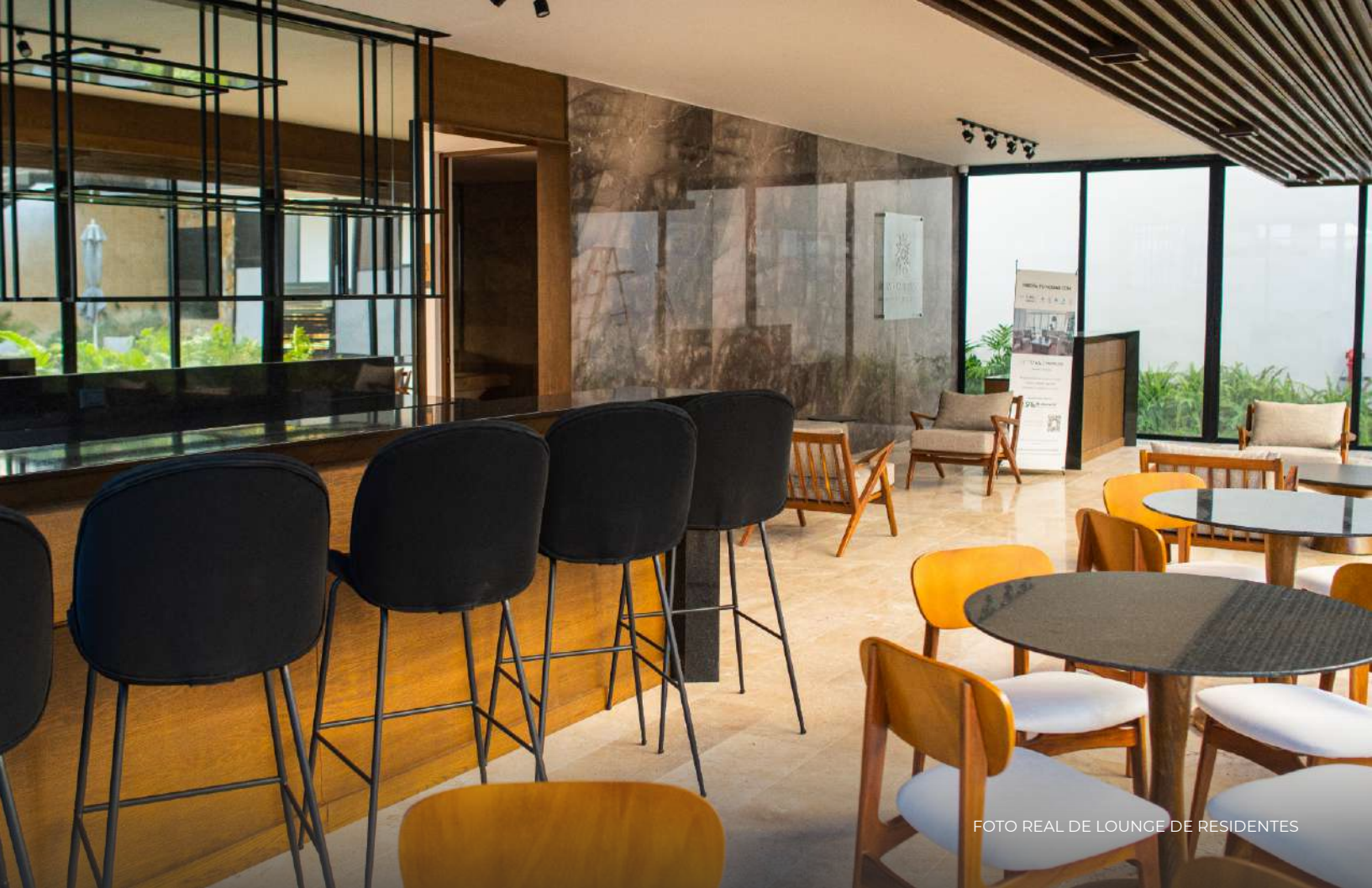
FOTO REAL DE LOUNGE DE RESIDENTES