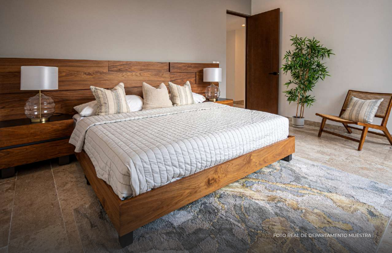
FOTO REAL DE DEPARTAMENTO MUESTRA