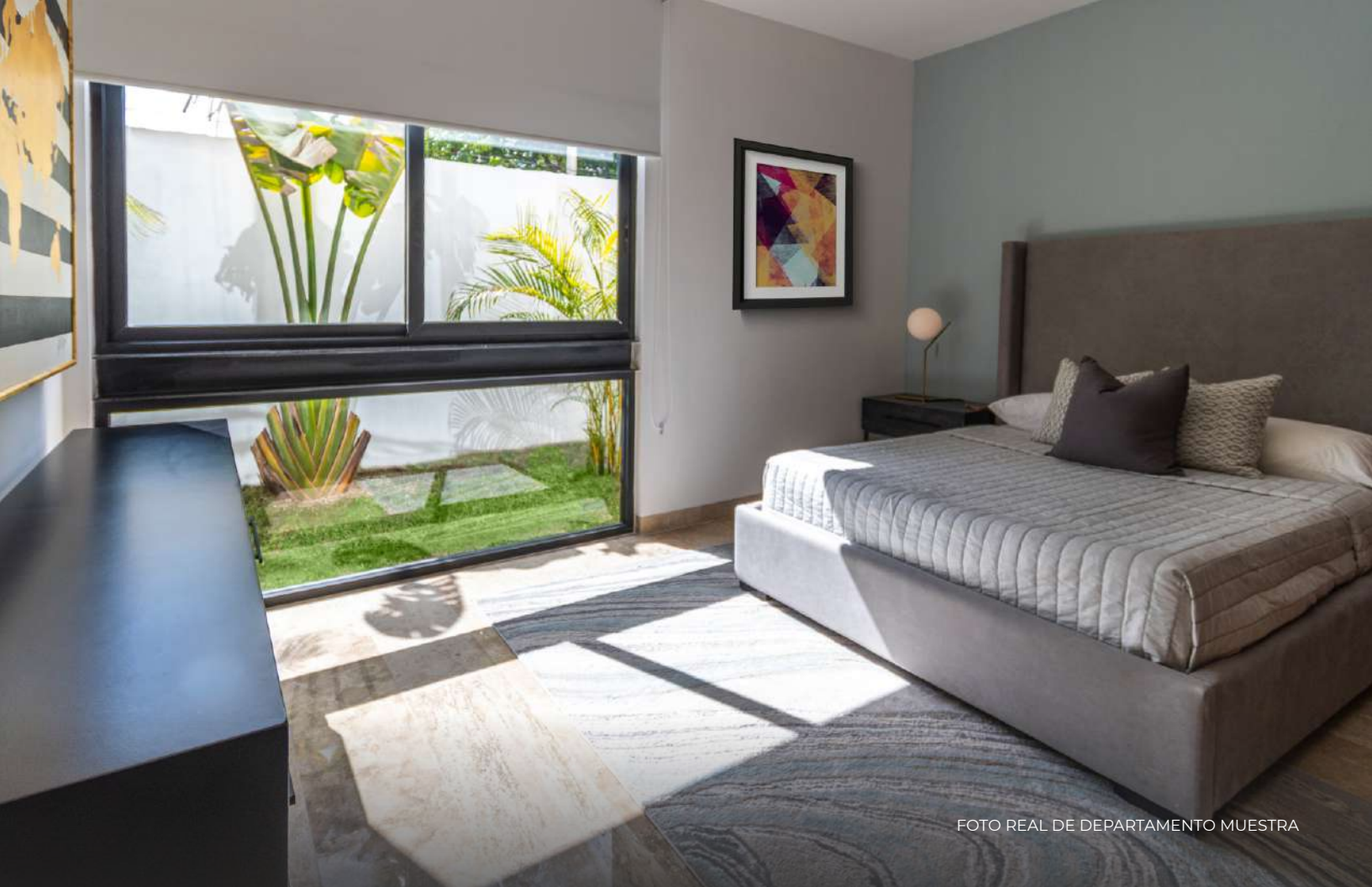
FOTO REAL DE DEPARTAMENTO MUESTRA