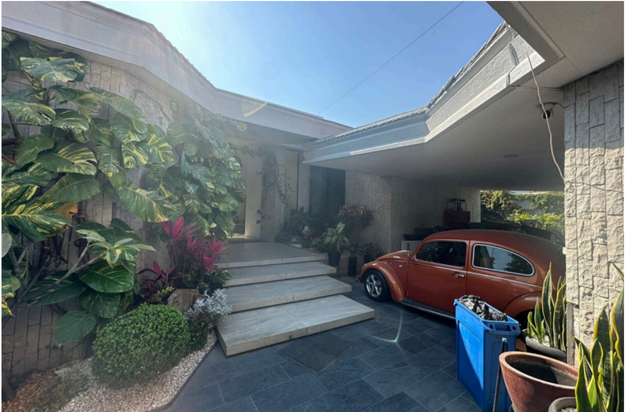
Ingreso / cochera