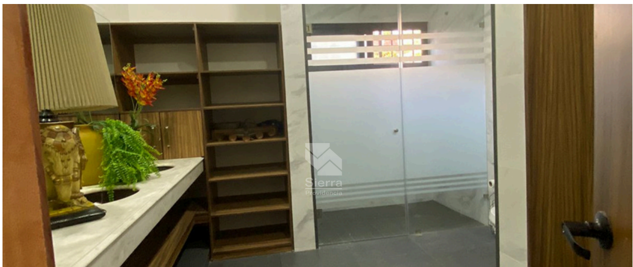
Baño recámara principal