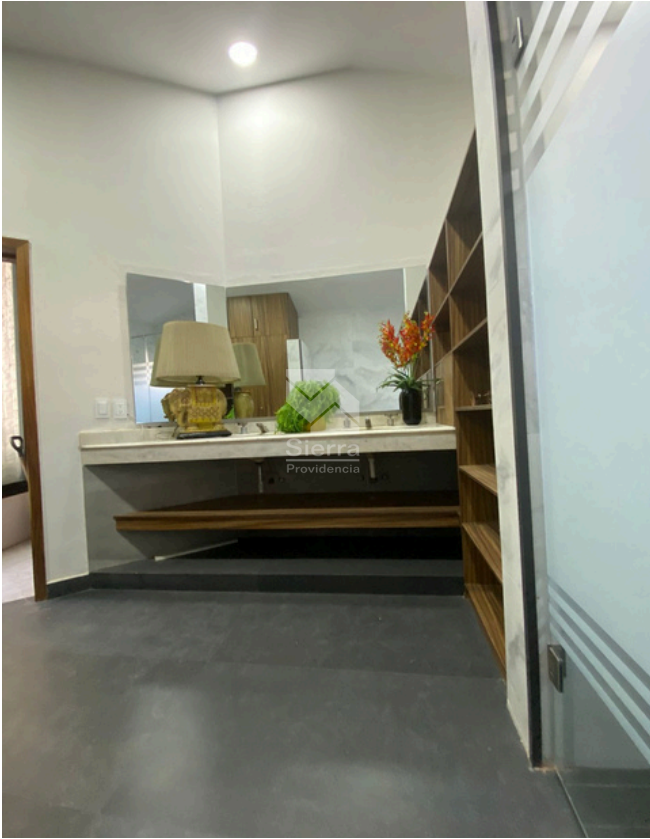
Baño segunda recámara