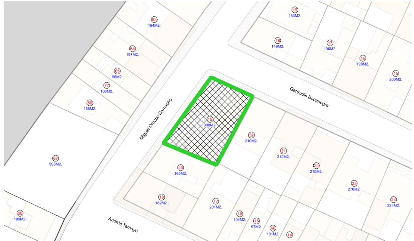
Croquis de Predio