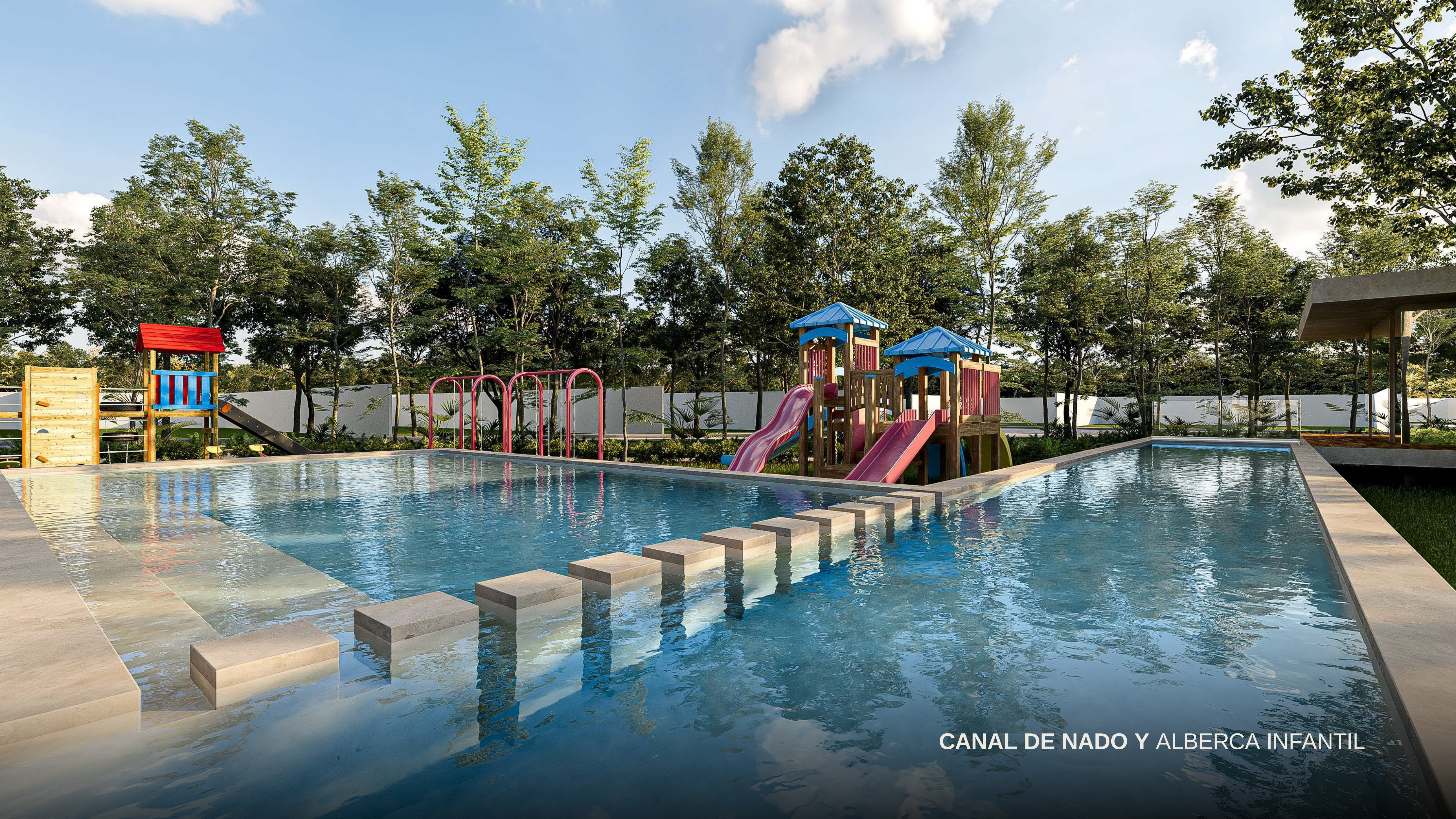
CANAL DE NADO Y ALBERCA INFANTIL