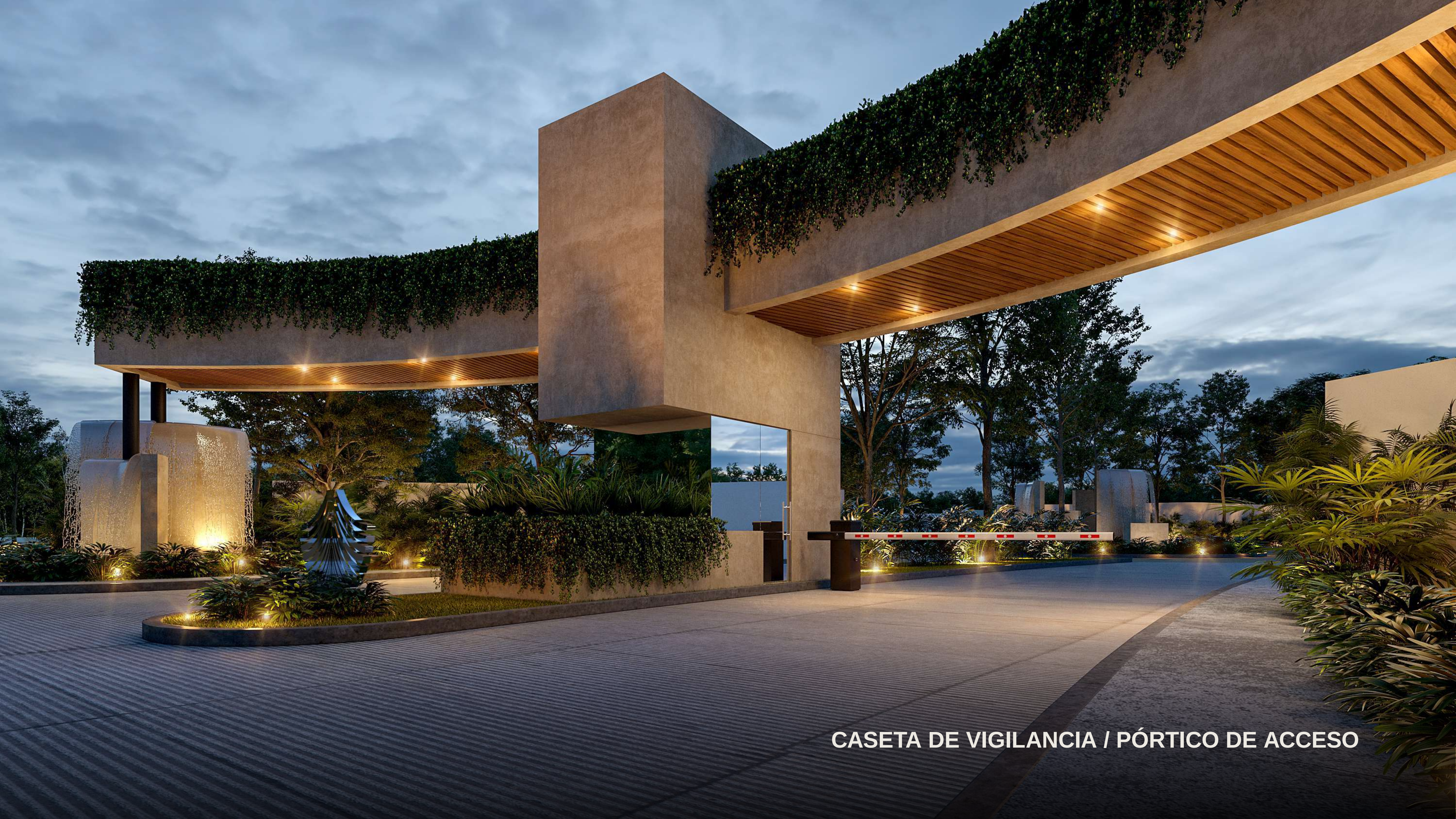
CASETA DE VIGILANCIA / PÓRTICO DE ACCESO