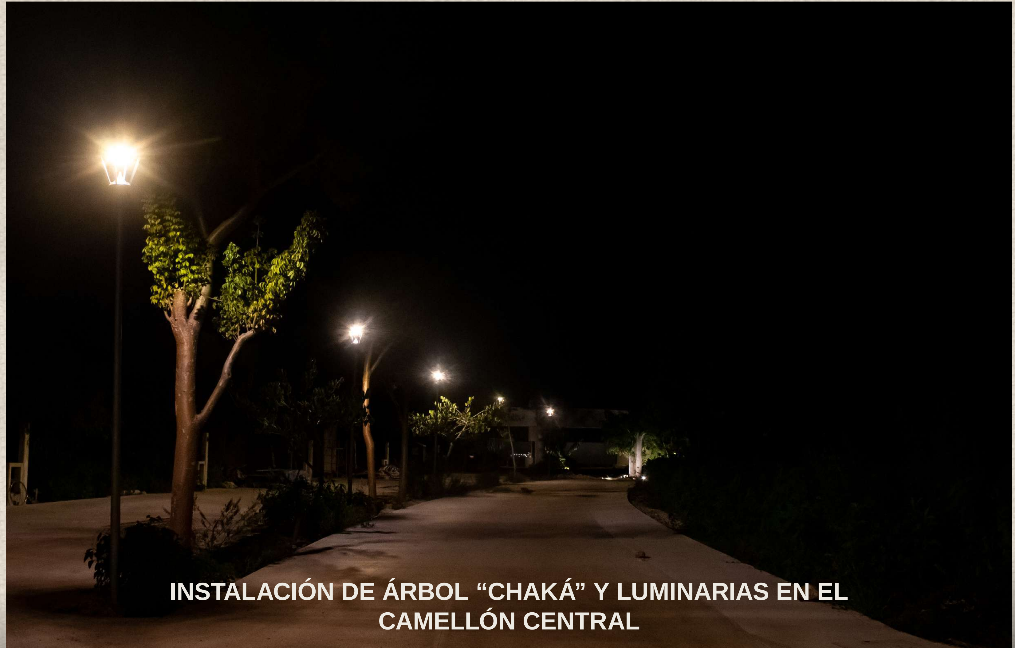
INSTALACIÓN DE ÁRBOL "CHAKÁ" Y LUMINARIAS EN EL CAMELLÓN CENTRAL