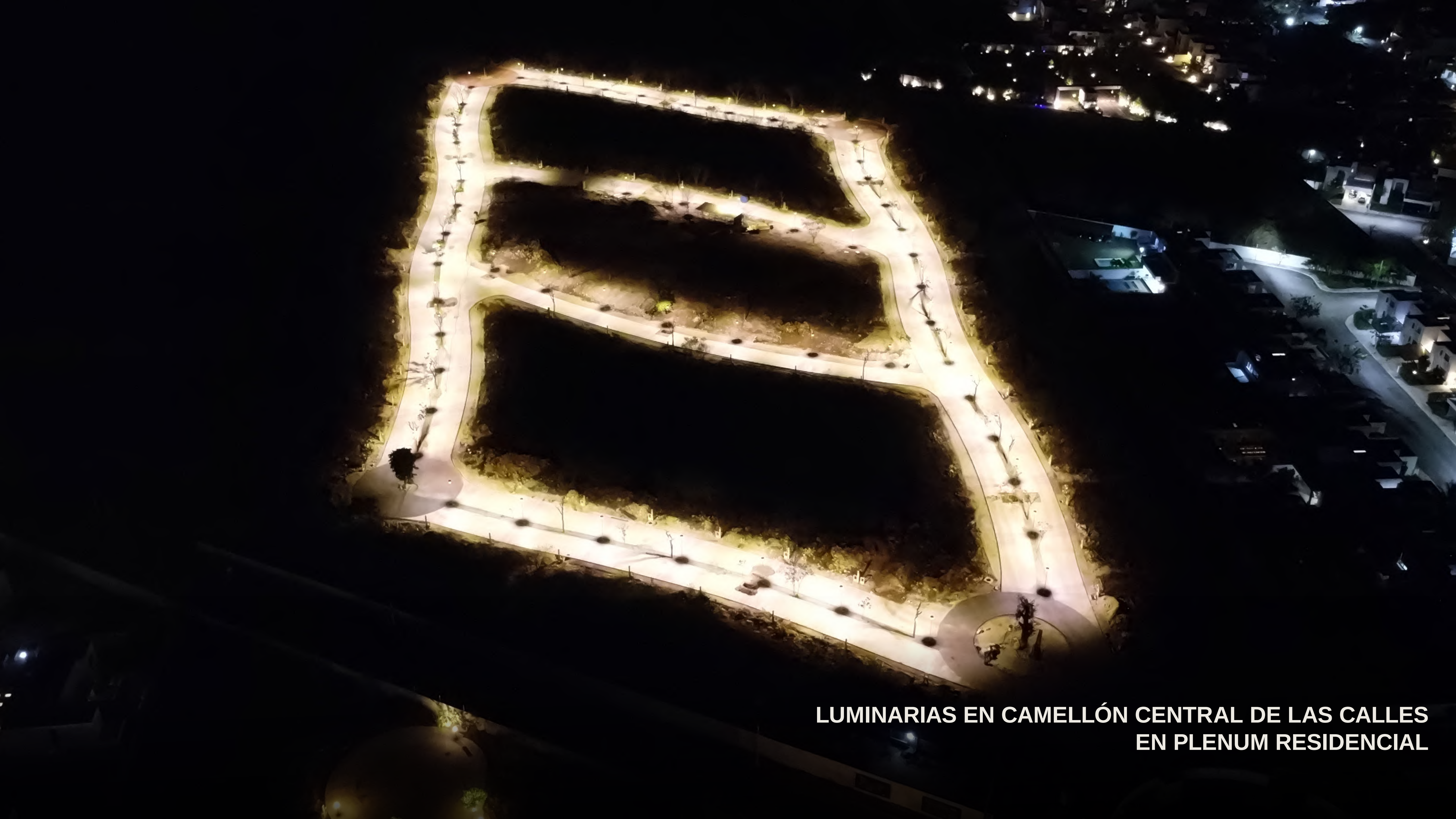
LUMINARIAS EN CAMELLÓN CENTRAL DE LAS CALLES EN PLENUM RESIDENCIAL