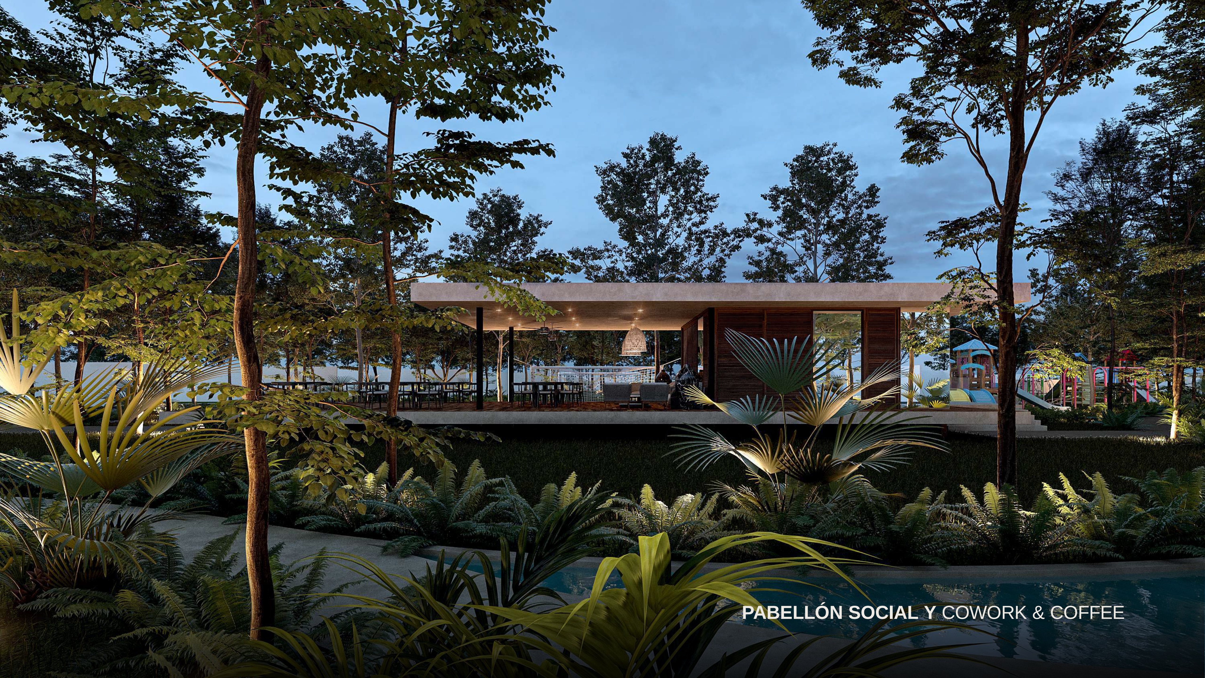
PABELLÓN SOCIAL Y COWORK & COFFEE