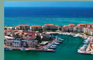
3. MARINA CAP CANA