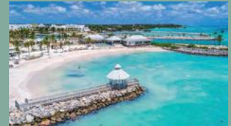
4. API BEACH