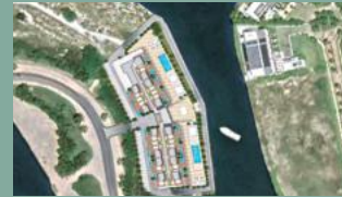
1. MARINA GARDEN