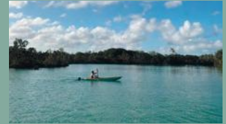
2. LAGO AZUL CAP CANA