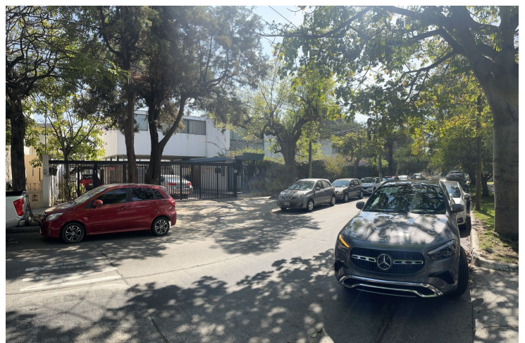
Frente sobre calle Santa Rita