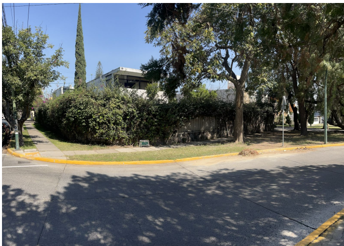
Esquina y banqueta sobre Parque Juan Diego