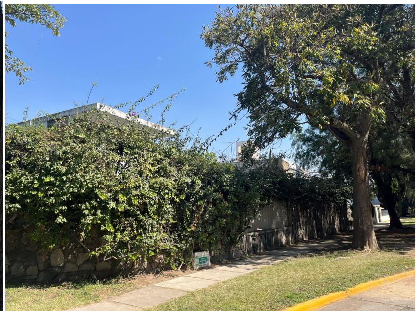
Frente sobre calle Parque Juan Diego