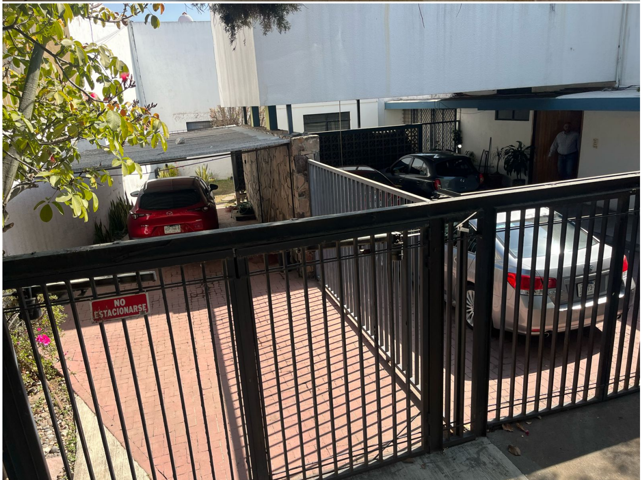
Cochera automática semitechada, con dos divisiones para 7 lugares.