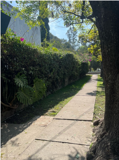
Frente sobre calle Santa Rita