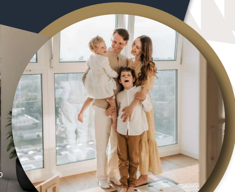
IMAGEN DE CARÁCTER ILLUSTRATIVO