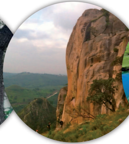
Cerro del Diente