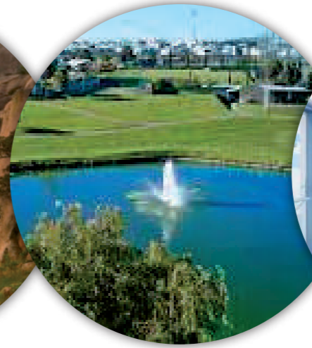
Club de Golf Valle imperial