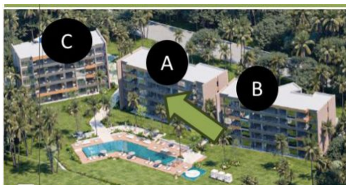
Solea Palms ( Vendiendo Edificio A).

El cliente compra con un 10% y continúa pagando el 40% al inicio de la construcción notificado por el desarrollador y el 50% a la entrega en el último trimestre de 2027.