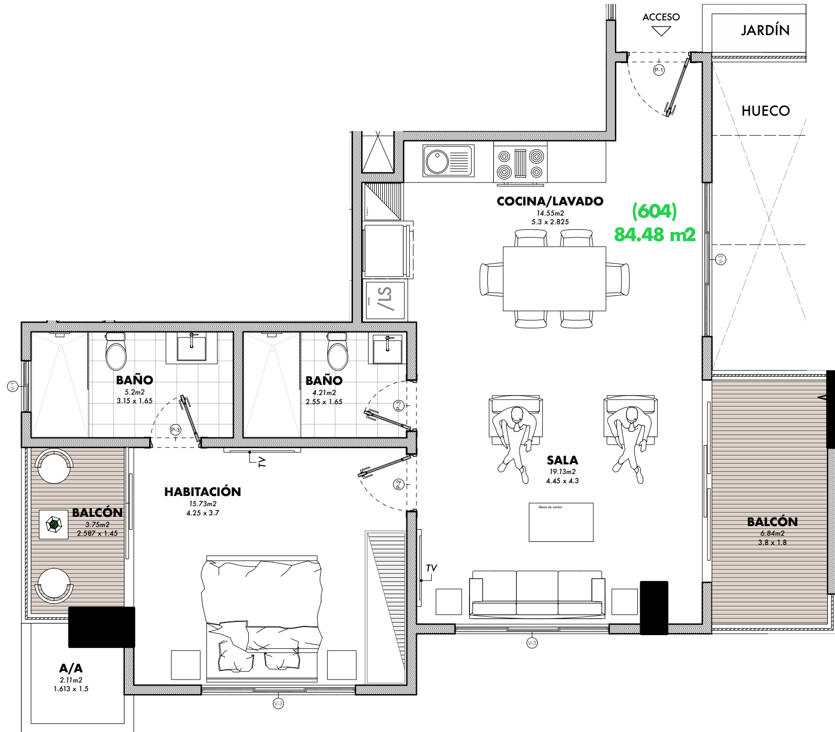
4 PLANTA ARQ. AMUEBLADA APTO. 604 Scale: 1:60