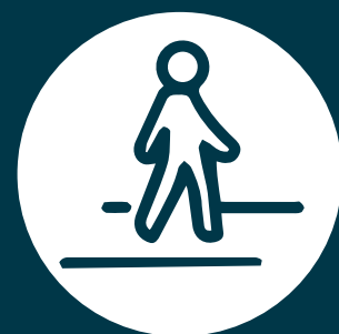
Banquetas de concreto