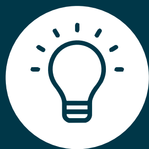
Luz eléctrica a pie de lote