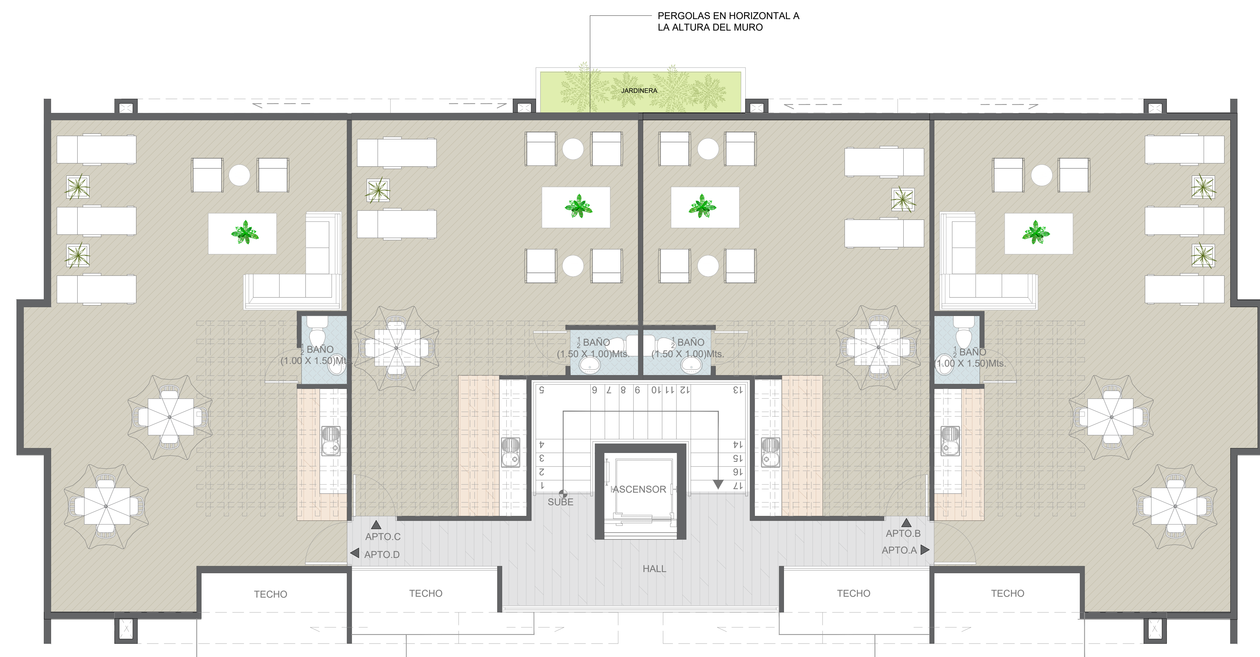
PLANTA ARQ. AMUEBLADA-EDIF. TIPO A NIVEL 5 (AZOTEA)