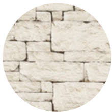
PIEDRA LAJA CLARA EN MUROS DE ALBERCA Y ESCALERA