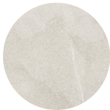
PISO SOHO COLOR BEIGE