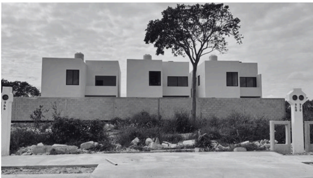
Imagen tomada al terreno.