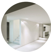
MUROS INTERIORES EN YESO DIRECTO, PINTADOS EN COLOR BLANCO CLARO (PINTURA MARCA BEREL)

Se buscó estar apegados a los materiales de los estilos mediterráneo y caribeño, siendo muy propio de estos el uso de madera, tonos calidos y piedra (cantera clara aladrillada en este caso) para muros. Buscamos incluir algunos materiales como el chukum nativo de la región, yeso para los plafones y muros con sus respectivos 3 acabados. Para los pisos interiores, se usó como principal el "Soho Beige de 50x100" (cerámico con apariencia de piedra clara) y para el exterior, concreto estampado pigmentado de color beige con patrón de ladrillo de piedra.