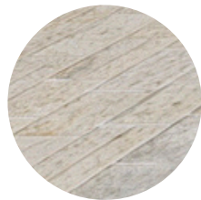
PISO DE CEMENTO ESTAMPADO CON PATRON DE LADRILLO