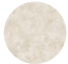
CHUKUM EN EXTERIORES E INTERIORES