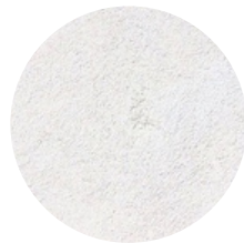
ACABADO EXTERIOR A 3 CAPAS