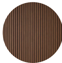
LOUVER DE WPC TIPO MADERA "se cotiza aparte"