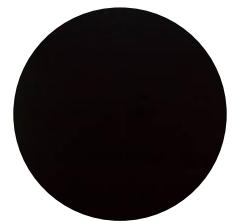
ALUMINIO NEGRO EN VENTANAS Y CLAROS Y ANDES.