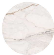
GRANITO GRIS EN COCINA