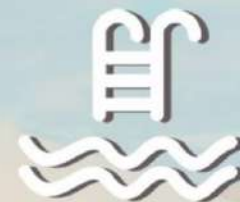
2 Pool Center