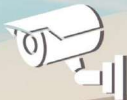
Circuito de grabación