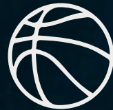
Cancha de Basquetbol