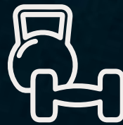
Gimnasio al aire libre