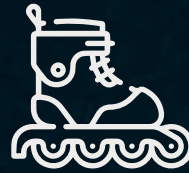
Pista de patinaje