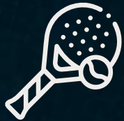
Canchas de pádel