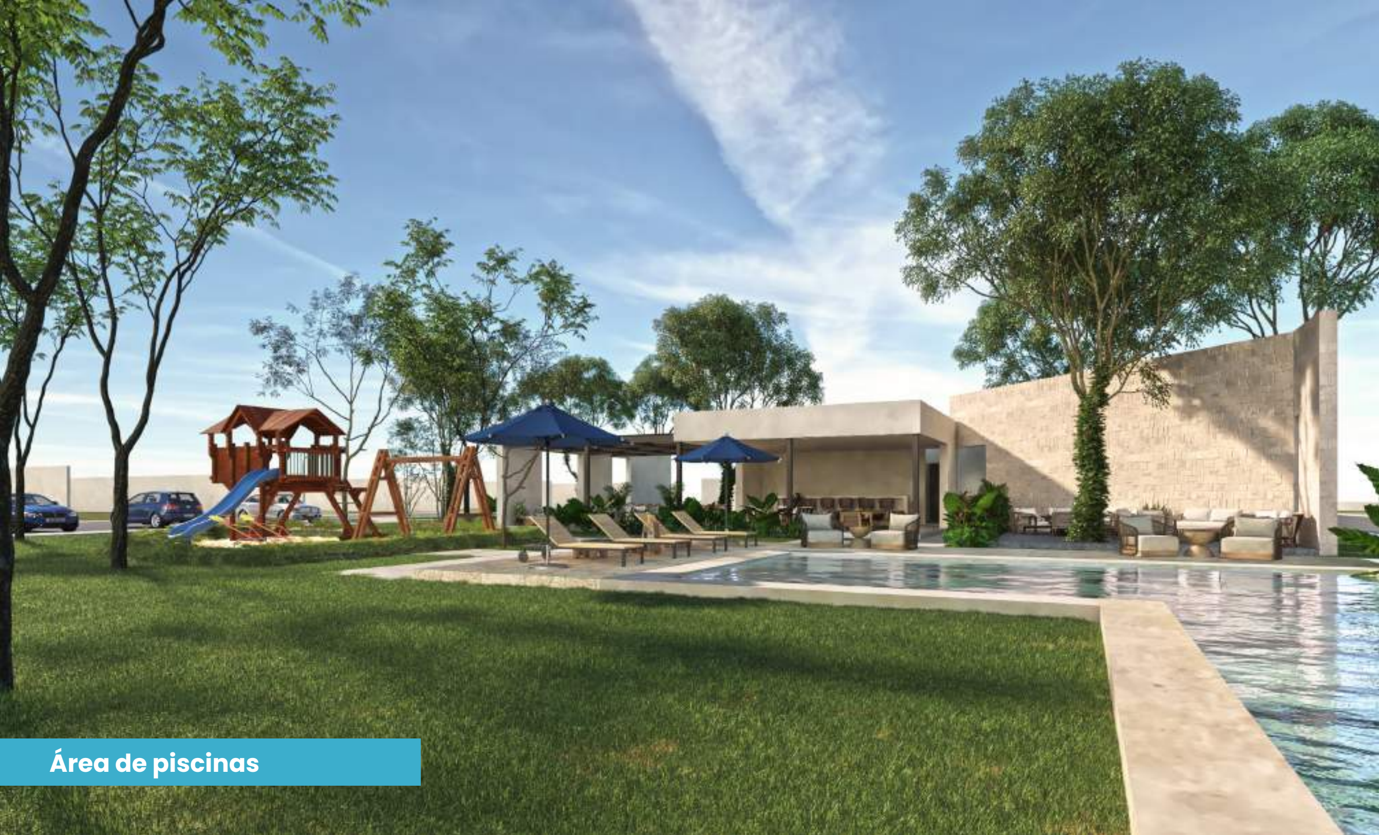
Área de piscinas