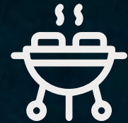
Área de asadores y pícnic