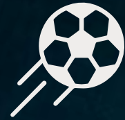
Cancha de Futbol