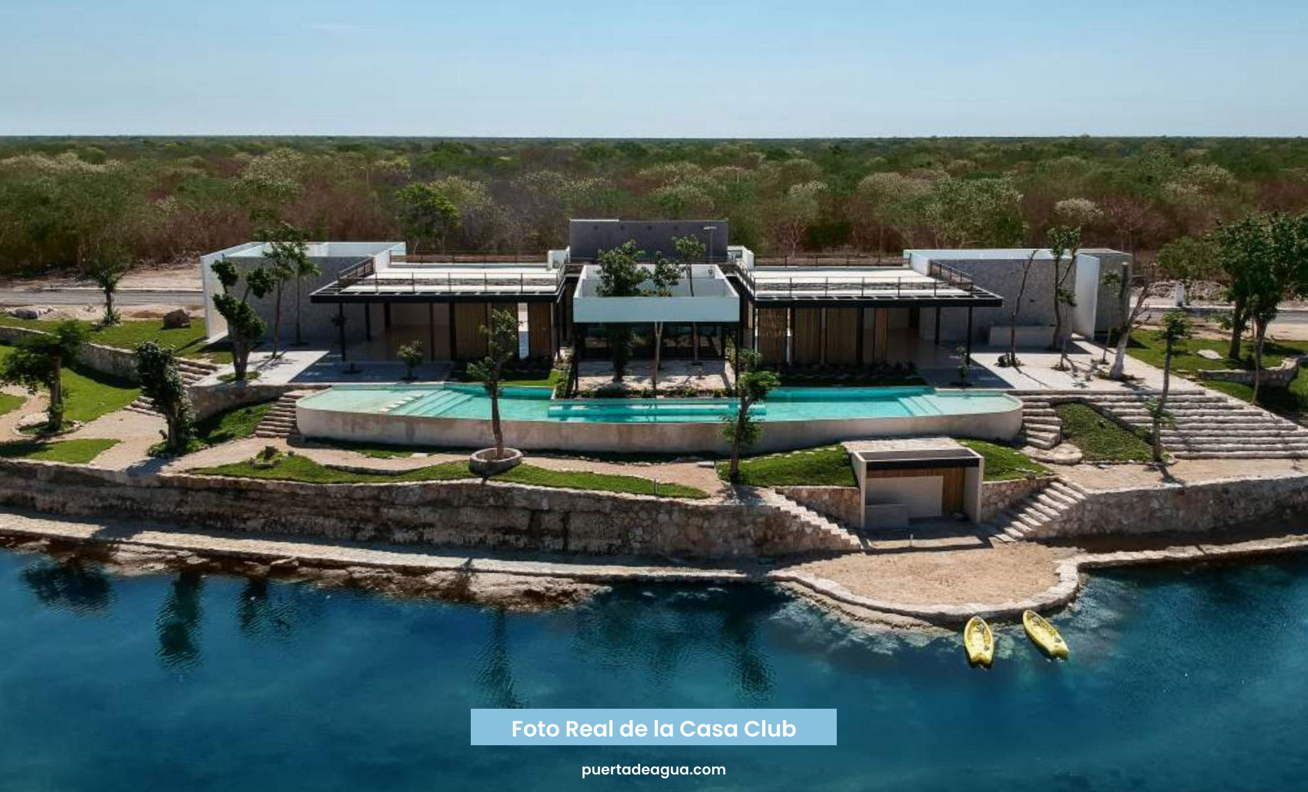
Foto Real de la Casa Club