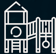
Área de juegos infantiles