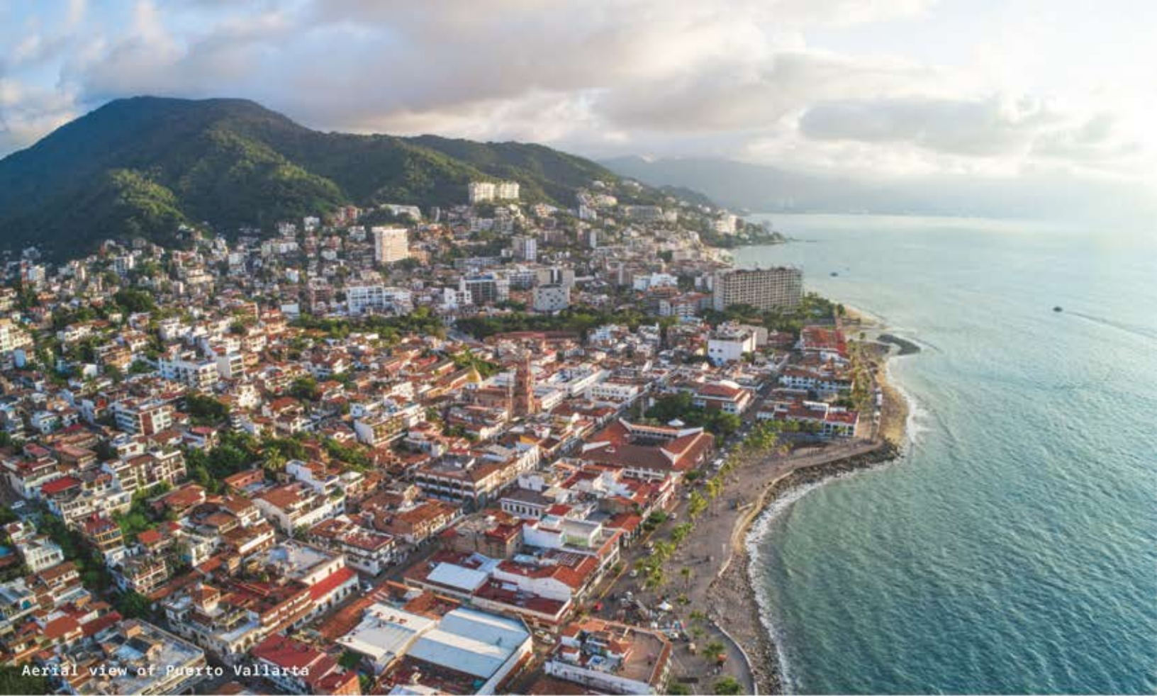
Aerial view of Puerto Vallarta