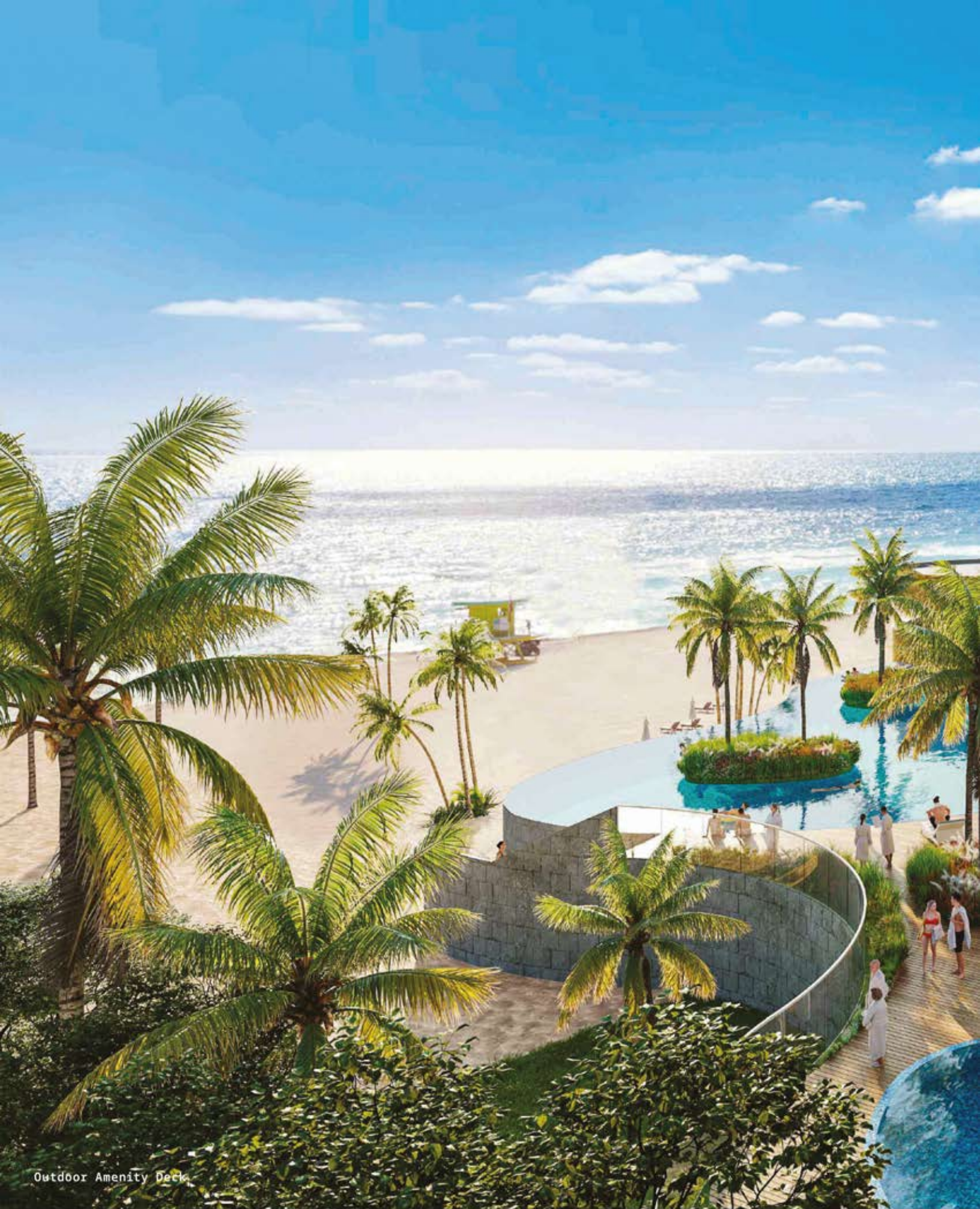
Outdoor Amenity Deck