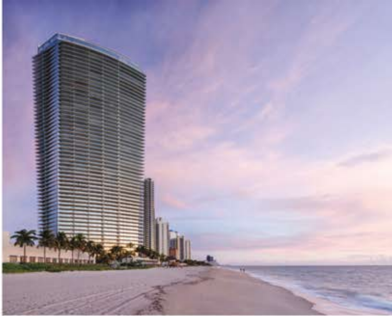
RELATED GROUP Residences by ARMANI/CASA, Sunny Isles, FL