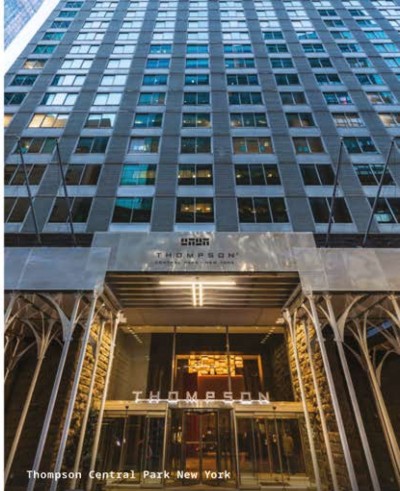
Thompson Central Park New York