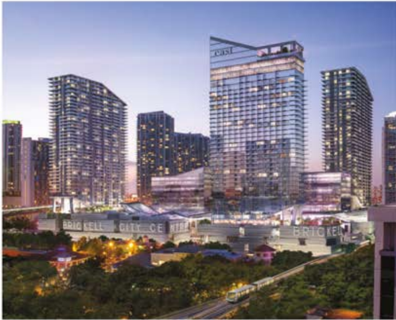
ARQUITECTONICA Brickell City Centre, Brickell, FL