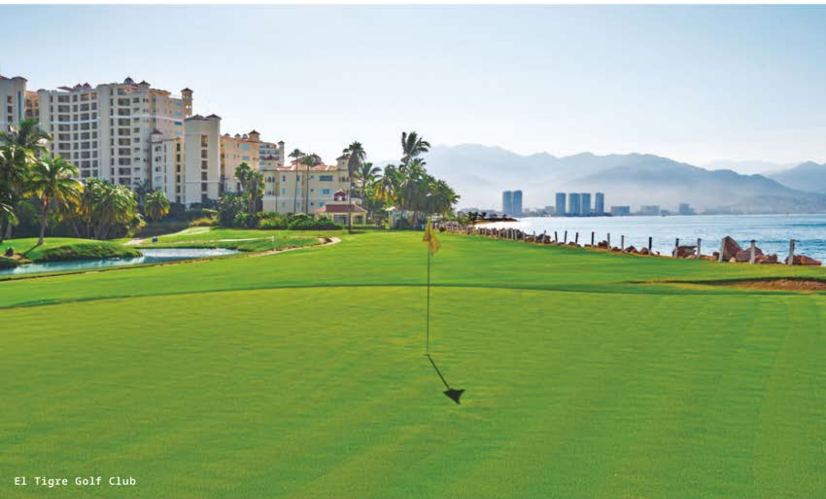
El Tigre Golf Club