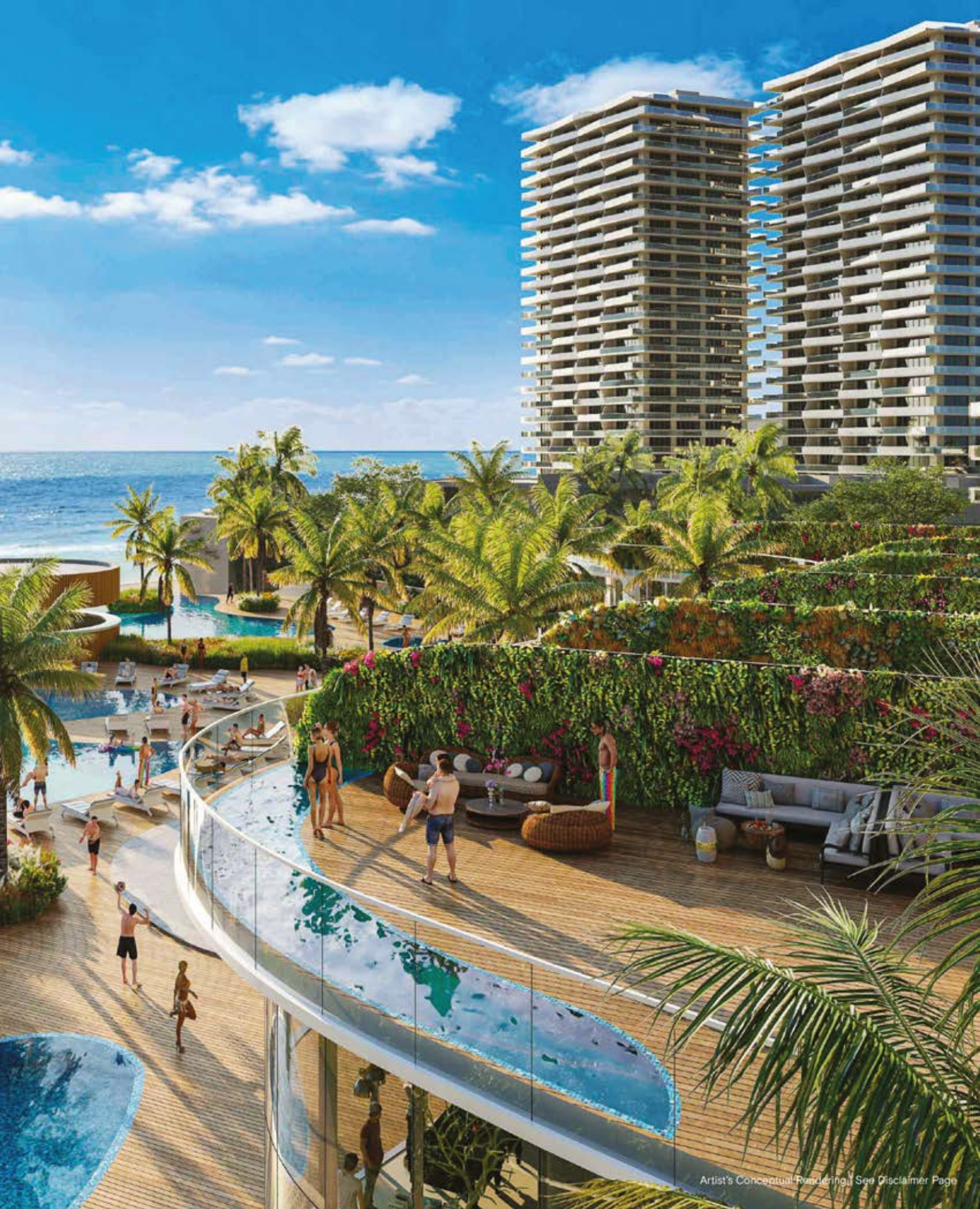
Artist's Conceptual Rendering. See Disclaimer Page