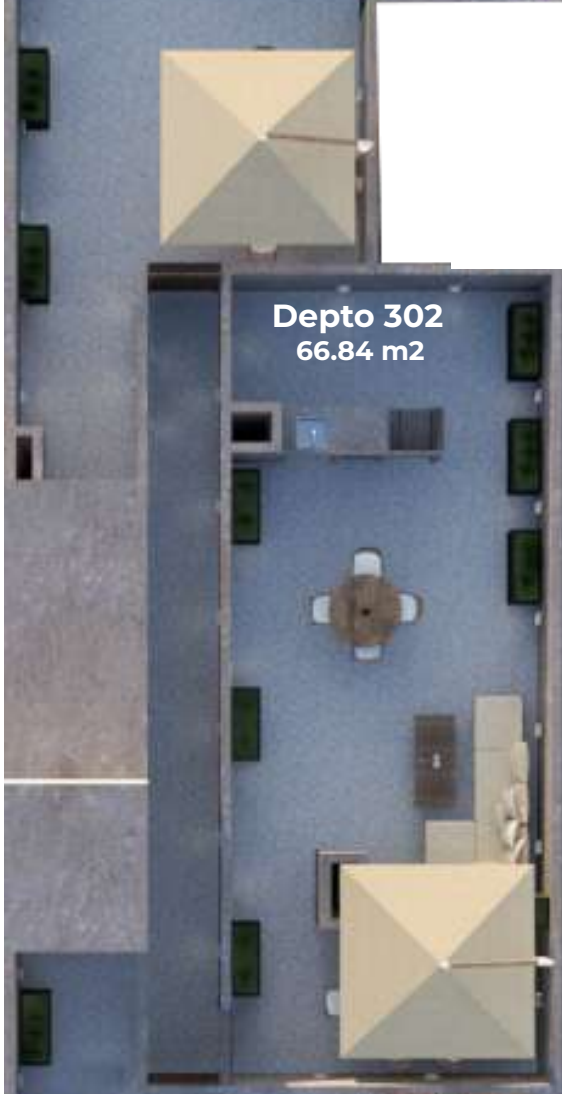
Depto 302 66.84 m 2