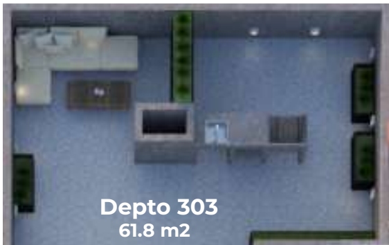
Depto 303 61.8 m 2