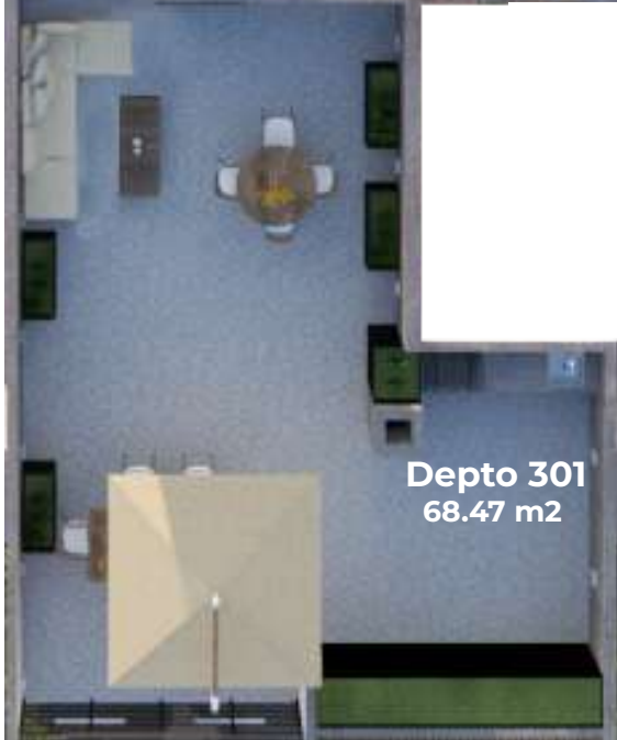
Depto 301 68.47 m 2