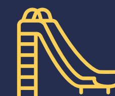
ÁREA DE JUEGOS