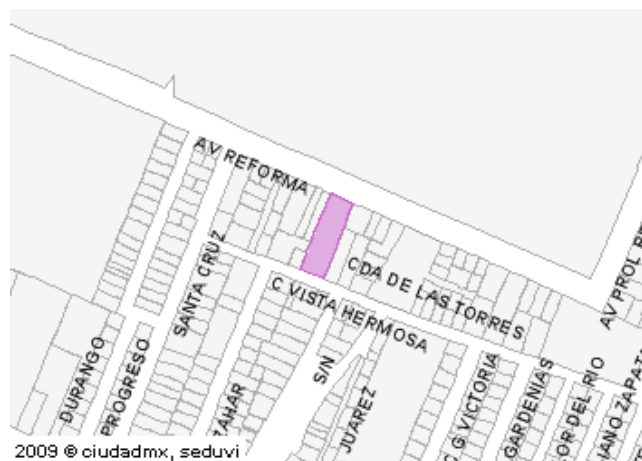
2009 © ciudadmx, seduvi Predio Seleccionado

Este croquis puede no contener las ultimas modificaciones al predio, producto de fusiones y/o subdivisiones llevadas a cabo por el propietario.