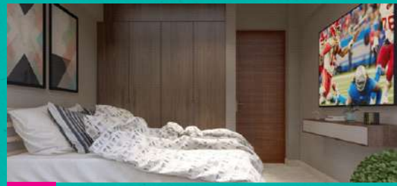
Puertas y Muebles de Madera