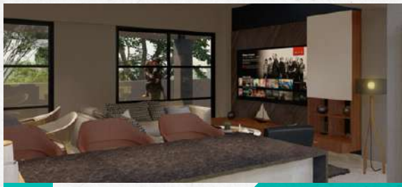
Pisos de Gran Formato