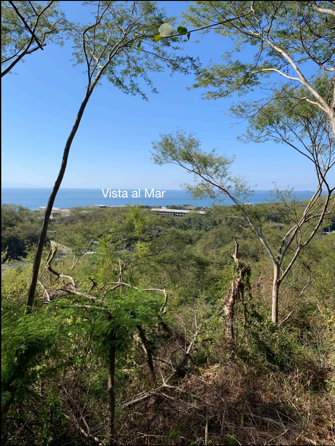
Vista al Mar