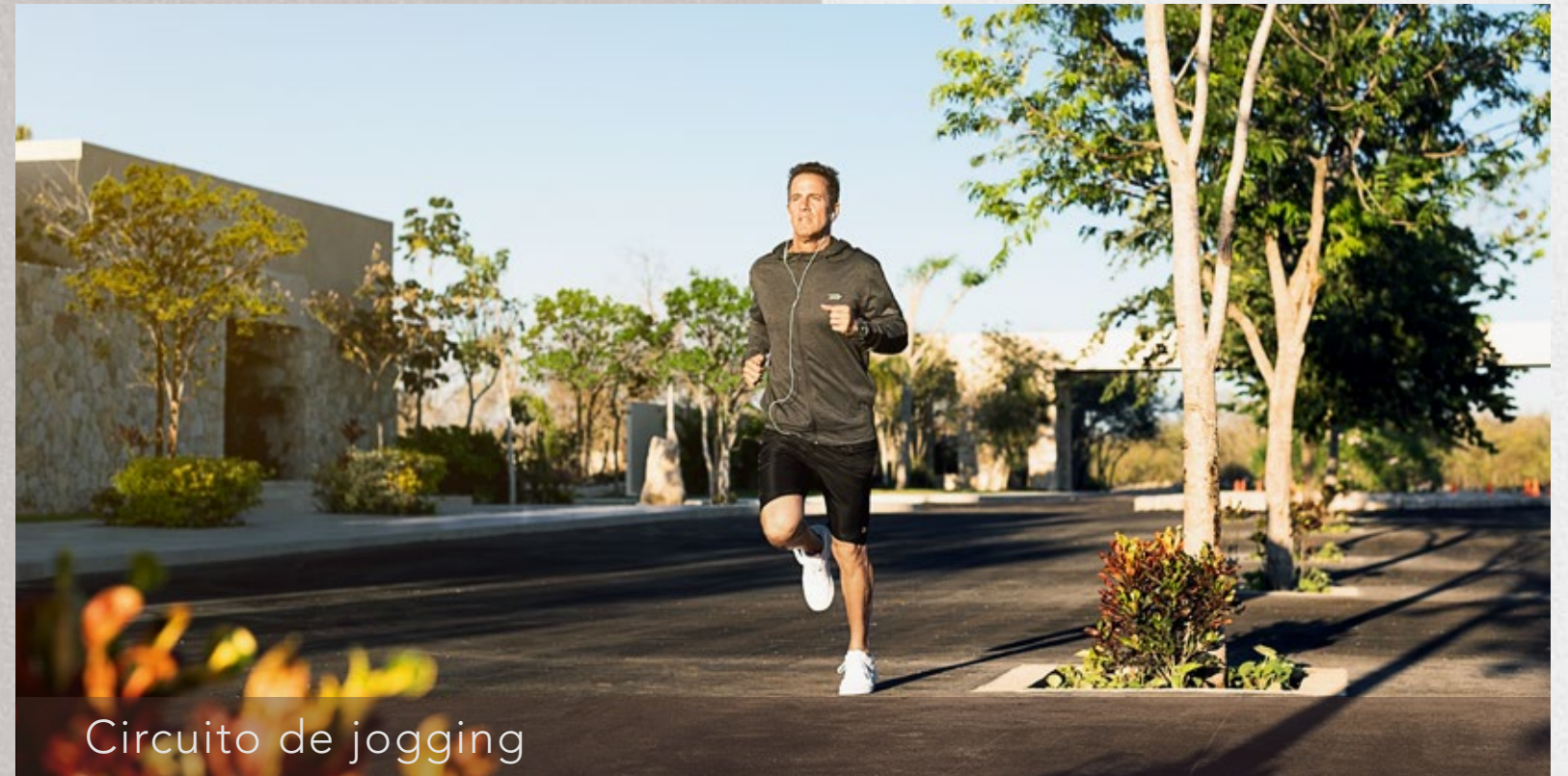
Circuito de jogging