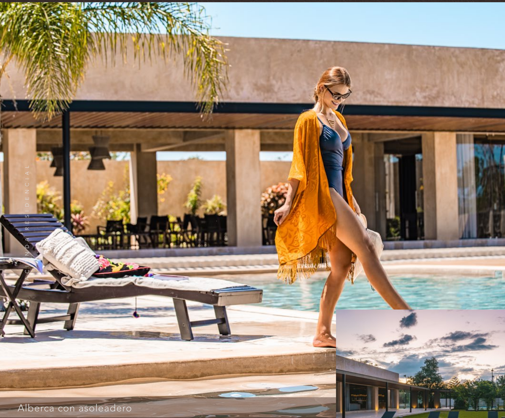
Alberca con asoleadero