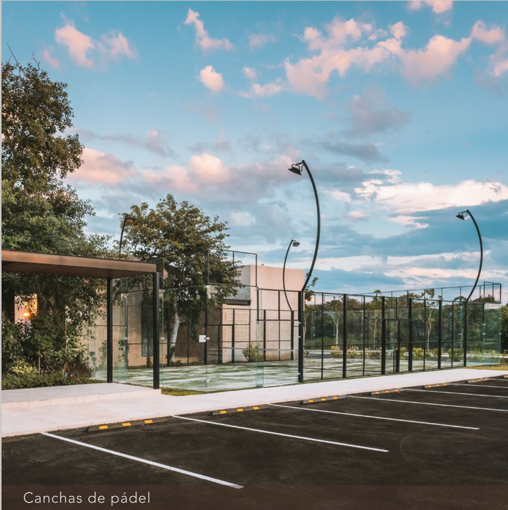
Canchas de pádel