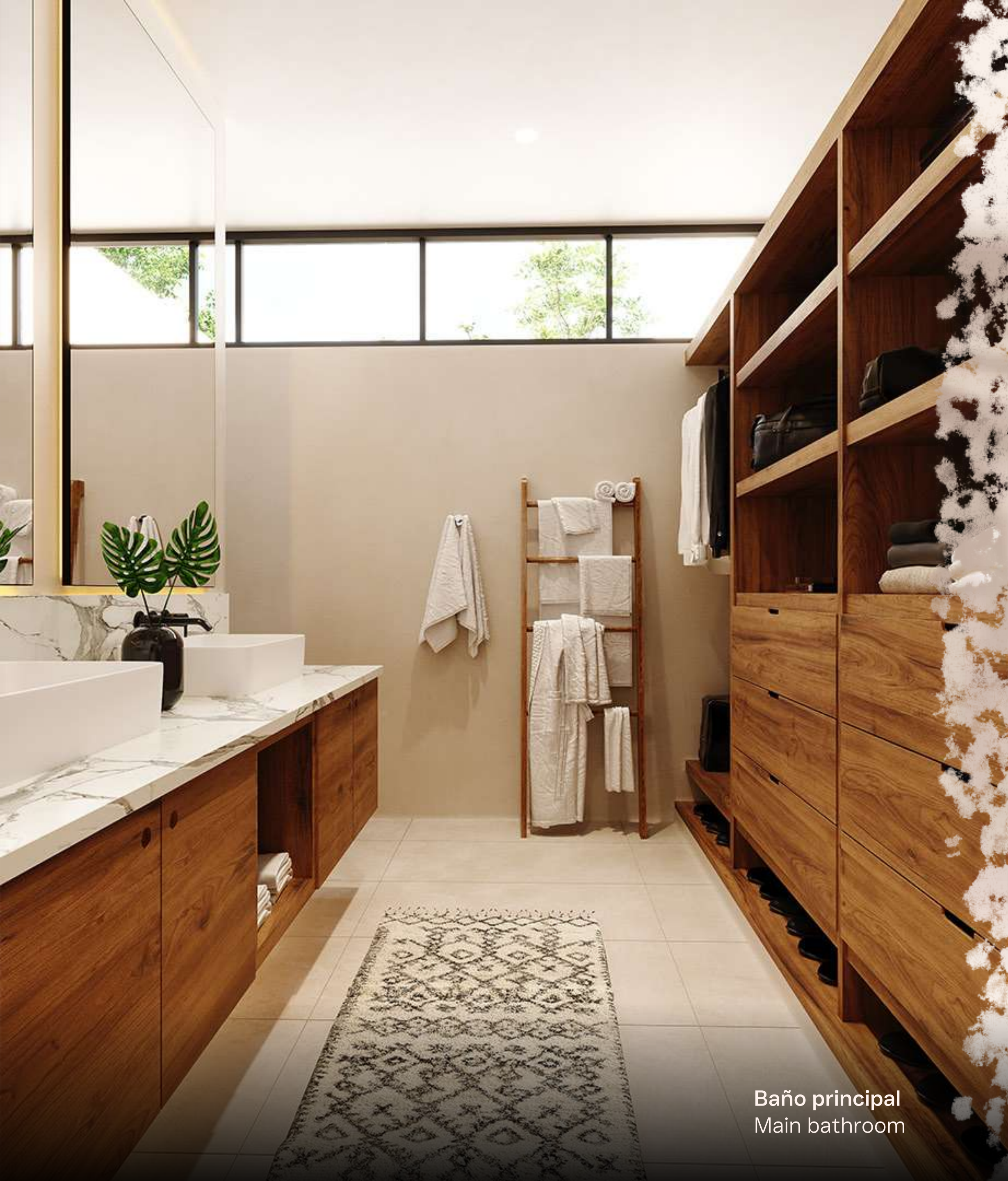
Baño principal Main bathroom