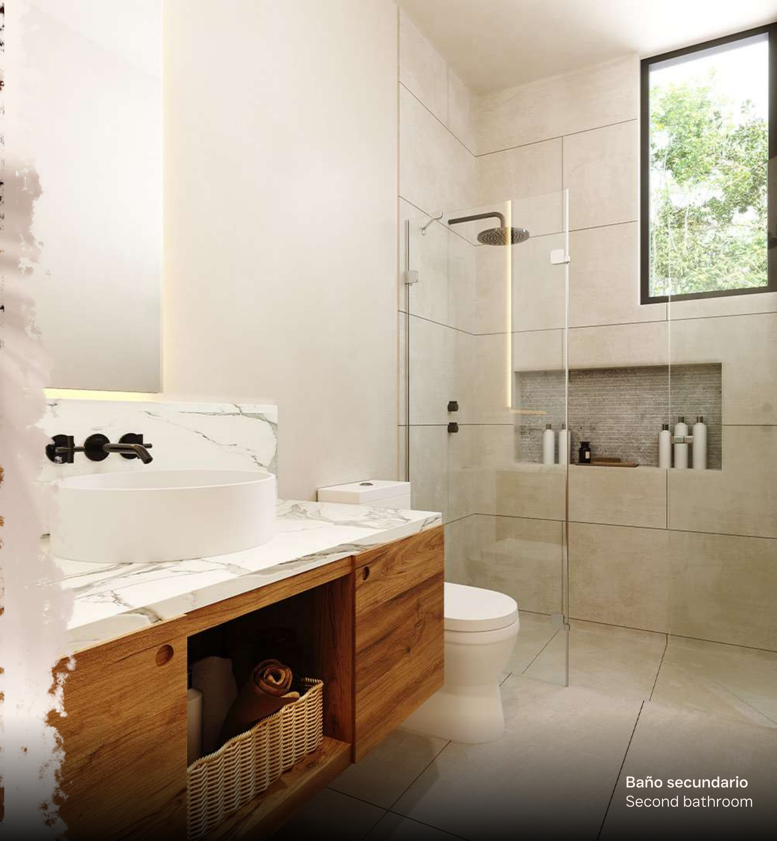
Baño secundario Second bathroom