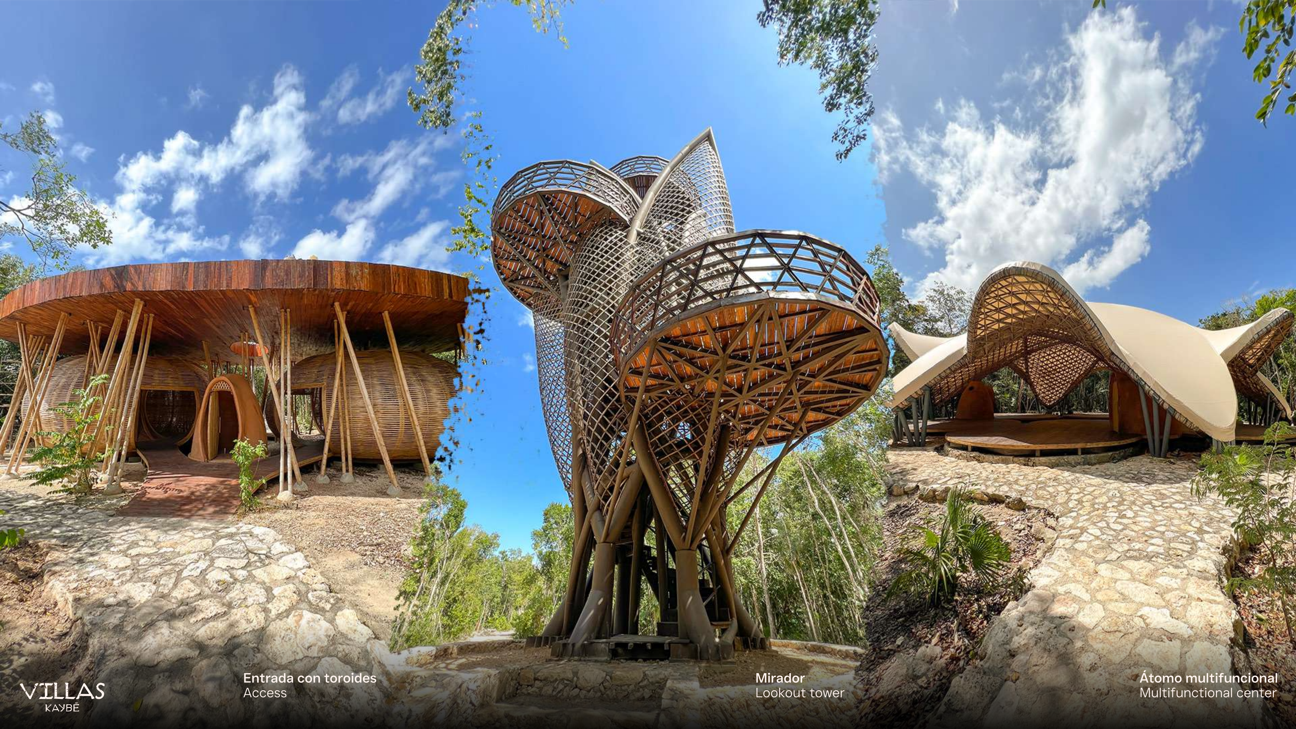
Entrada con toroides Access