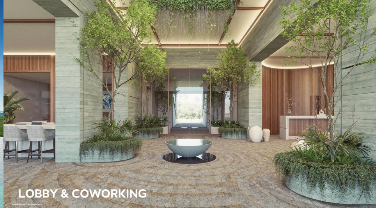
LOBBY & COWORKING