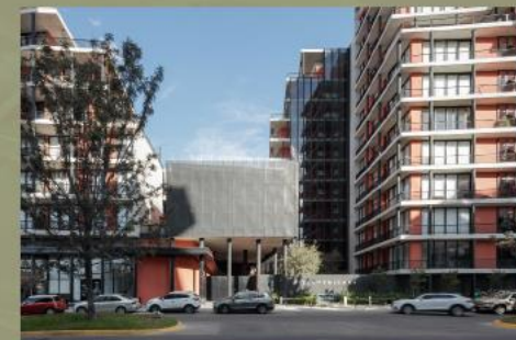
Vitia La Toscana Zona Metropolitana de Guadalajara, Jalisco