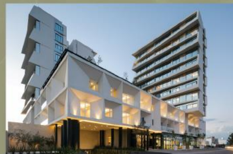
Torres La Toscana Zona Metropolitana de Guadalajara, Jalisco