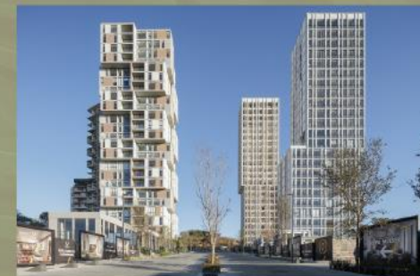
Ventura Zona Metropolitana de Guadalajara, Jalisco