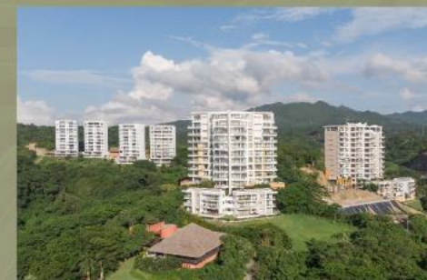
Alamar La Cruz de Huanacaxtle, Riviera Nayarit