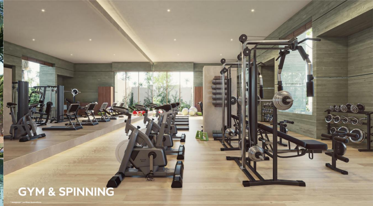
GYM & SPINNING