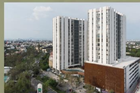
Classiqa Chapalita Zona Metropolitana de Guadalajara, Jalisco