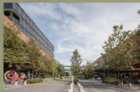
Punto Sur Lifestyle Boulevard Zona Metropolitana de Guadalajara, Jalisco