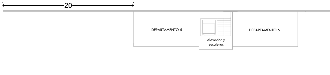
DIAGRAMA CONCEPTUAL SEGUNDO NIVEL