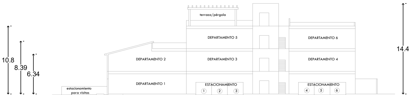
DIAGRAMA CONCEPTUAL SECCIÓN CONCEPTUAL