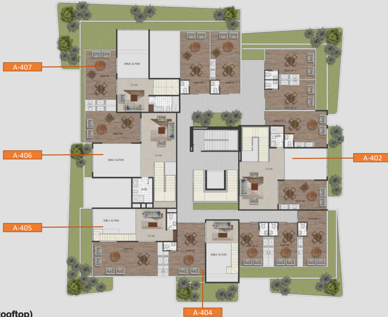
Planta Arquitectónica ( Rooftop )