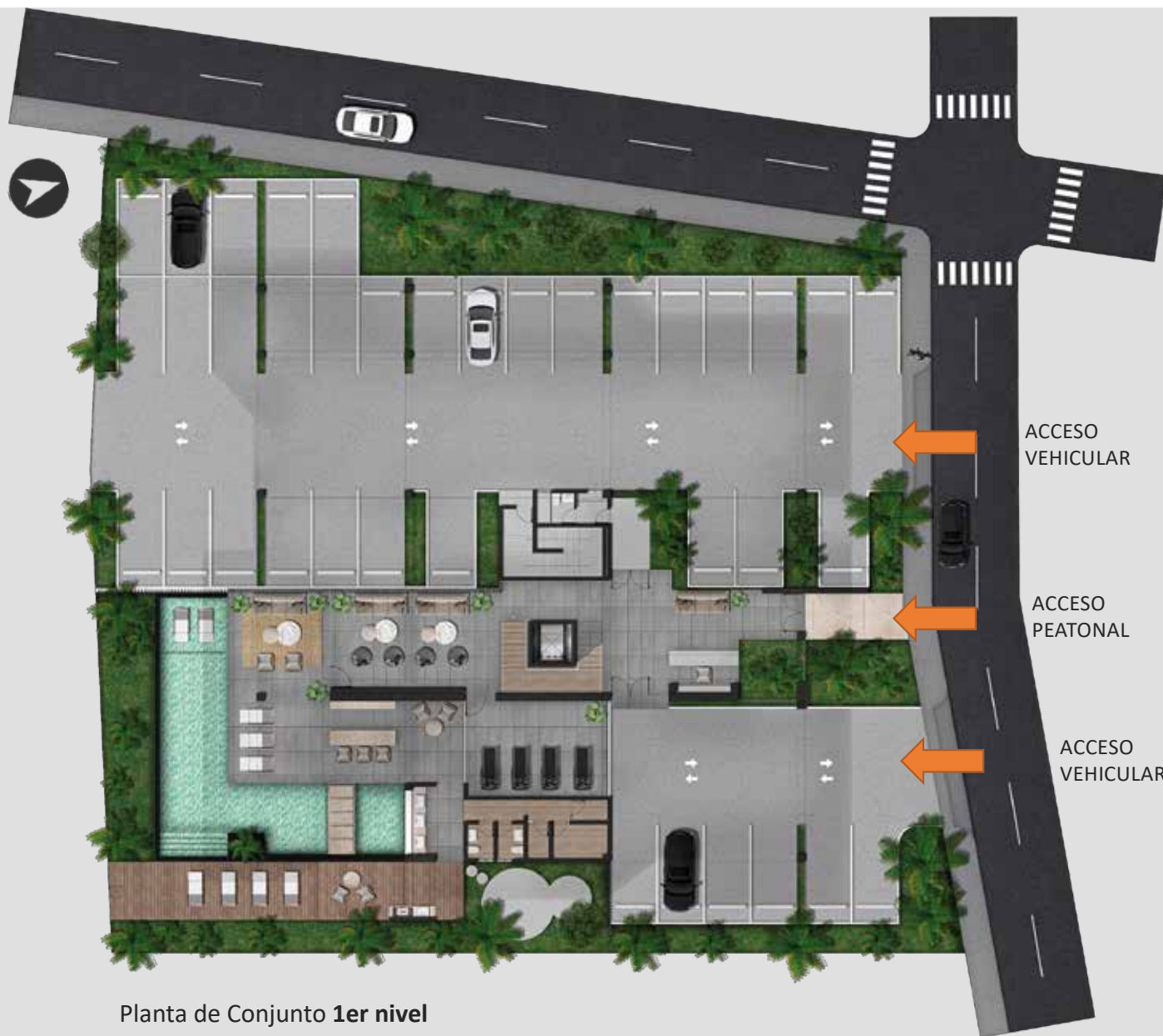
Planta de Conjunto 1er nivel