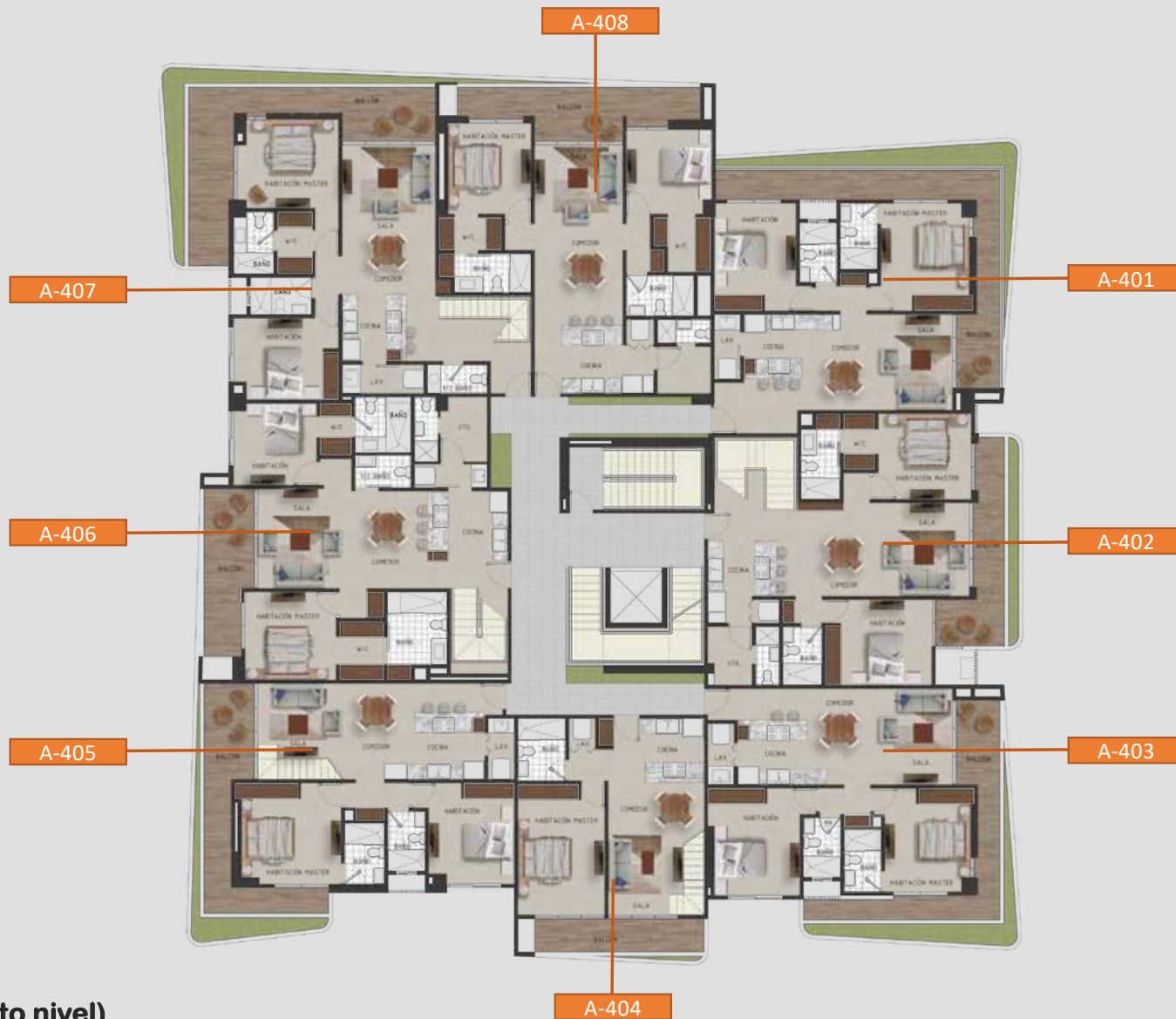
Planta Arquitectónica (4to nivel)