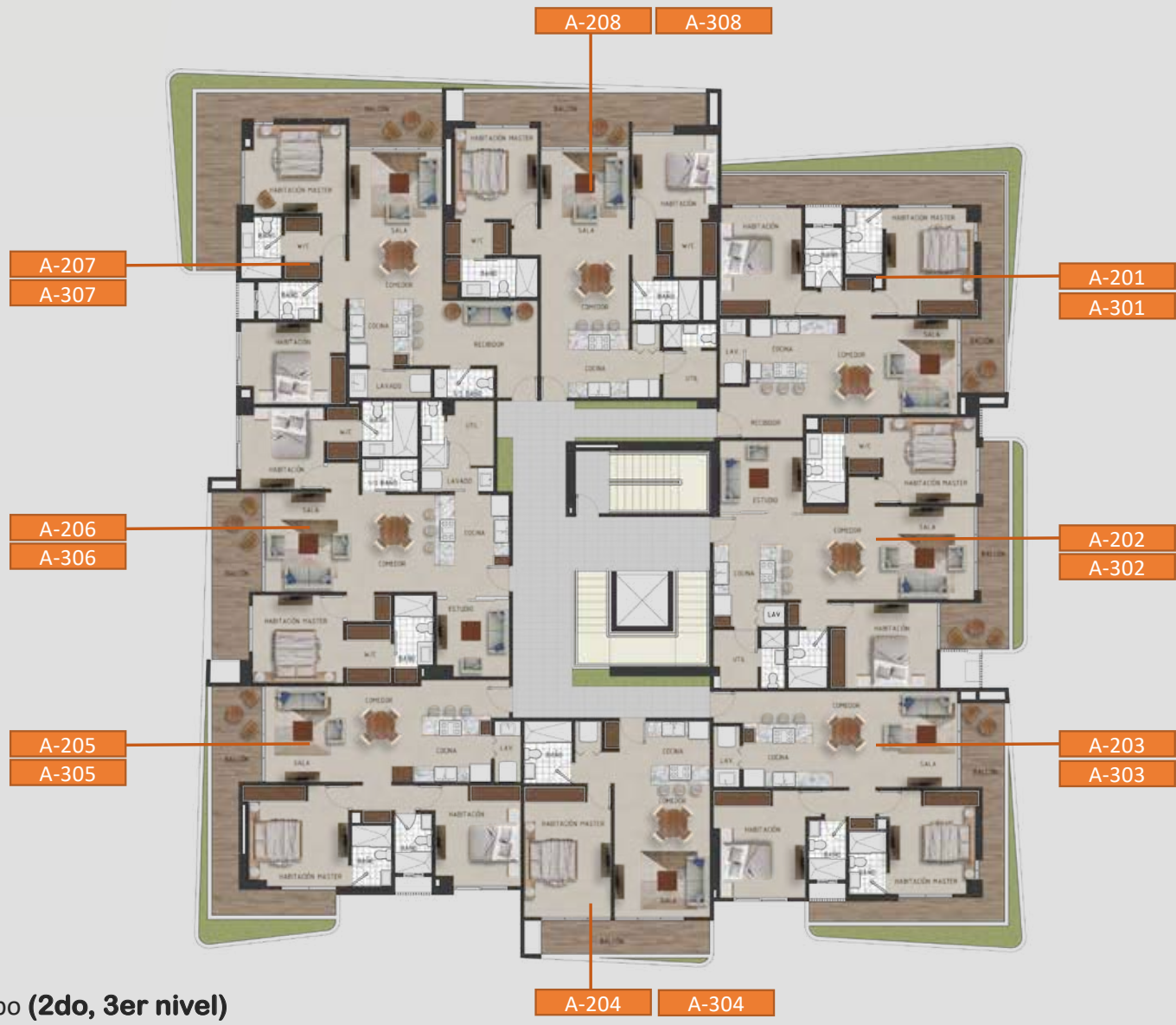
Planta Arquitectónica Tipo (2do, 3er nivel)