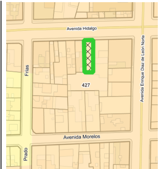
Croquis de Manzana