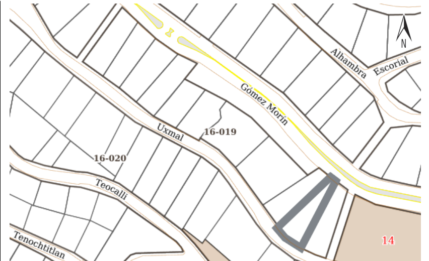
Croquis de Manzana