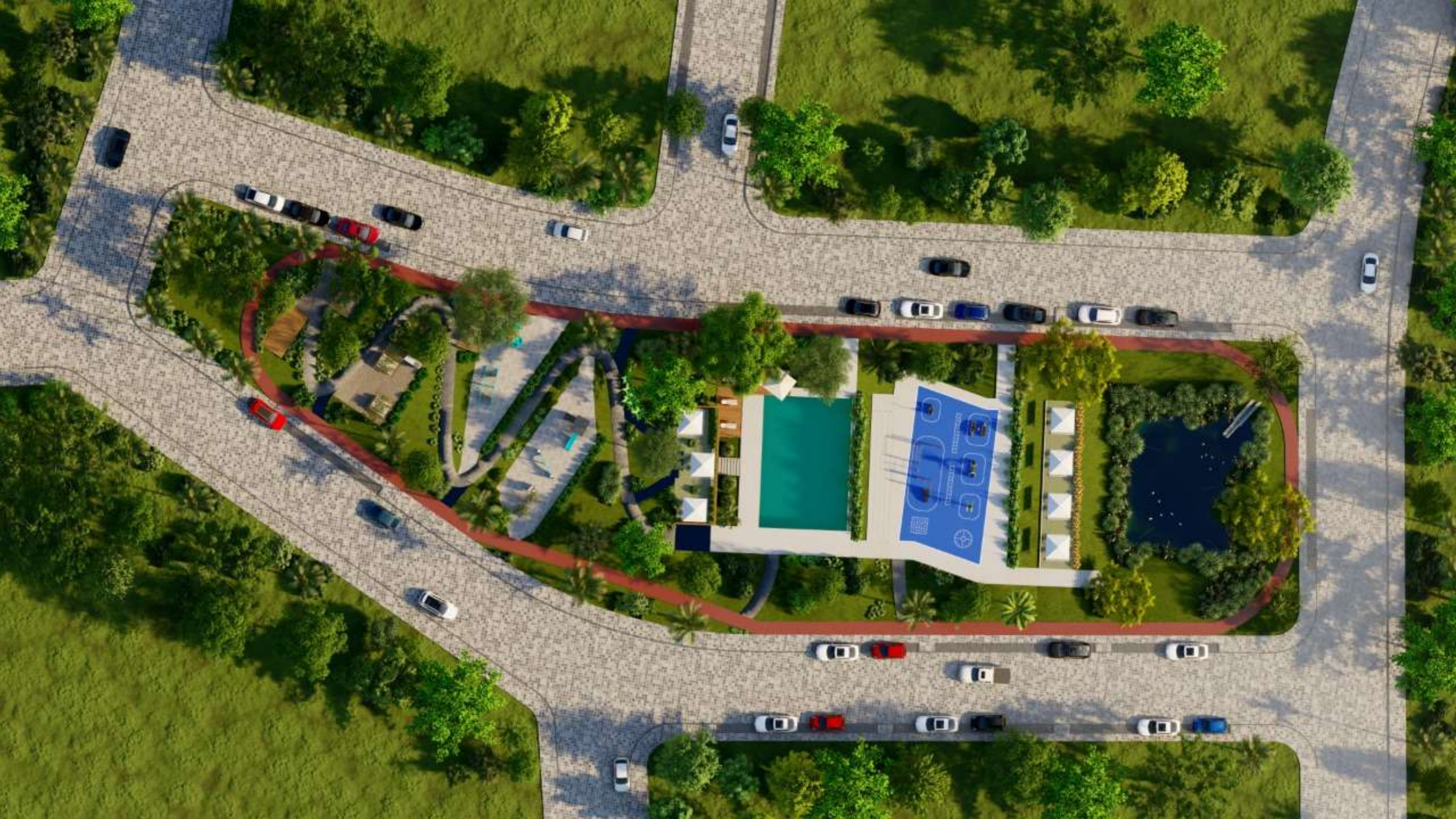
Parque recreativo con piscina deportiva, área de picnic, outdoor gym, juegos de niños y laguna