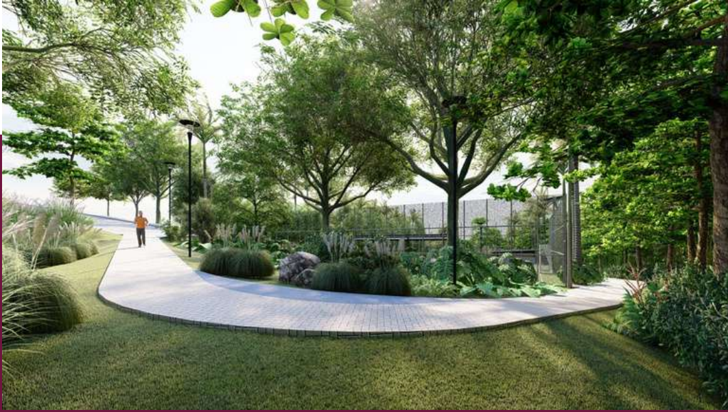
Senderos para correr