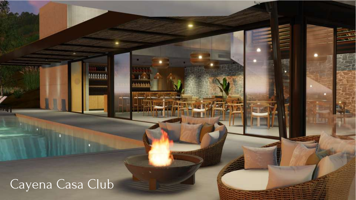
Cayena Casa Club