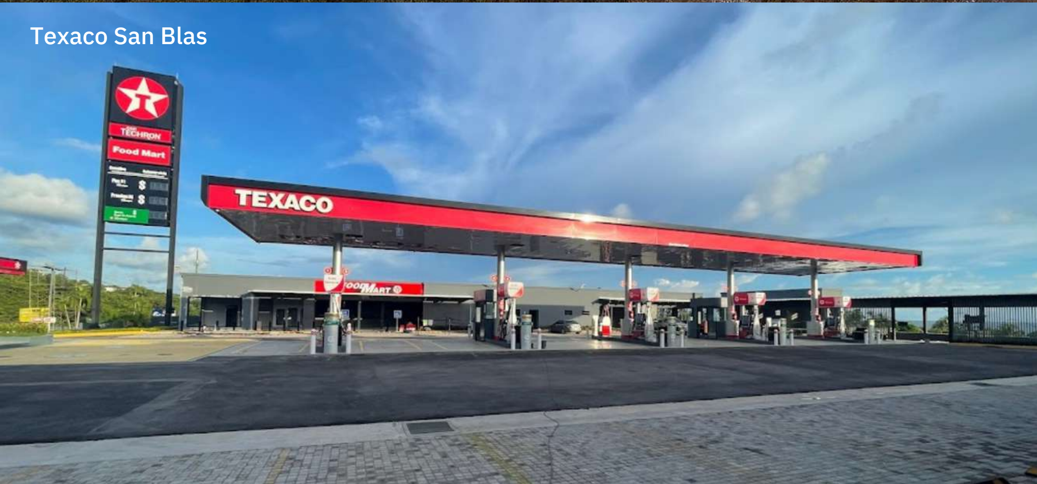
Texaco San Blas