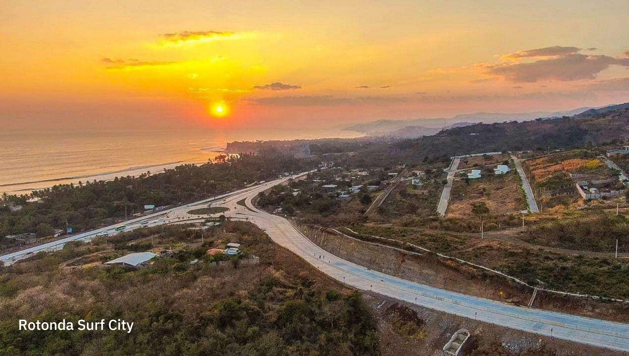
Rotonda Surf City