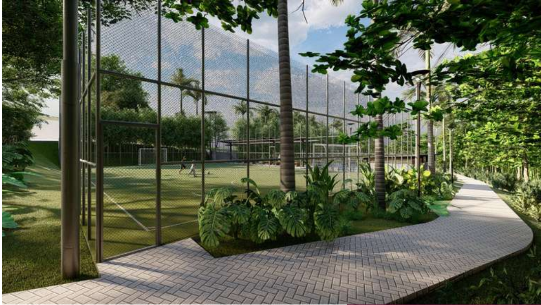
Cancha de tennis y fútbol