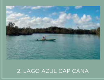
2. LAGO AZUL CAP CANA