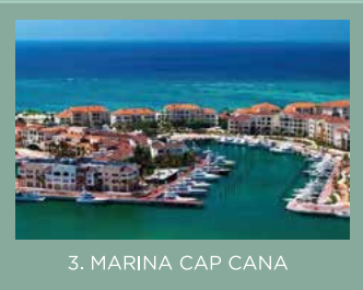
3. MARINA CAP CANA