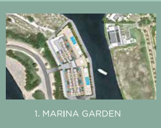
1. MARINA GARDEN