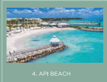
4. API BEACH