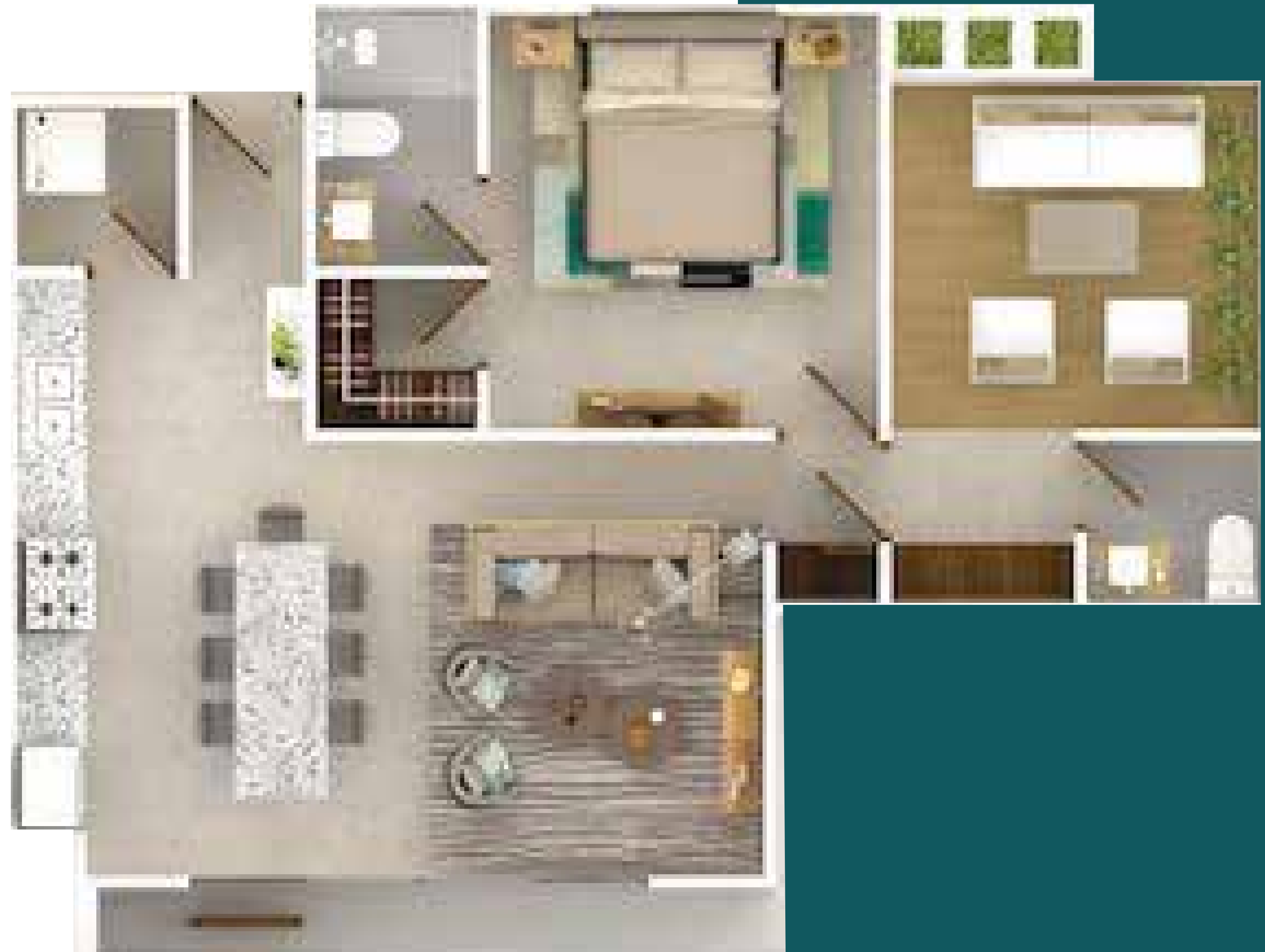
APARTAENTO 3ER PISO - 1 HAB.