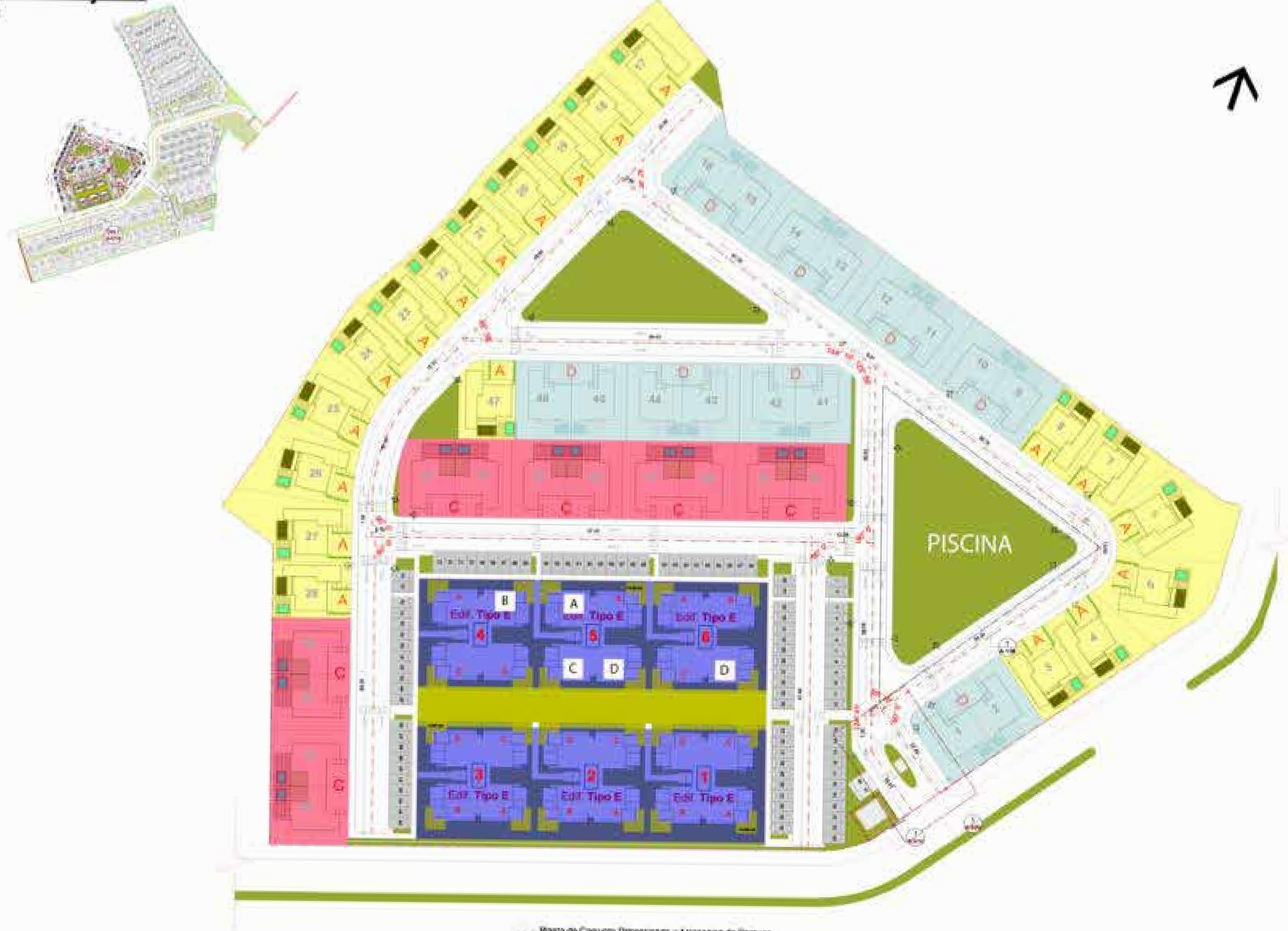
2 Planta de Conjunto Dimensiones y Asignación de Parqueo Escala 1:400