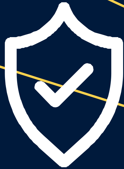
Caseta de Seguridad