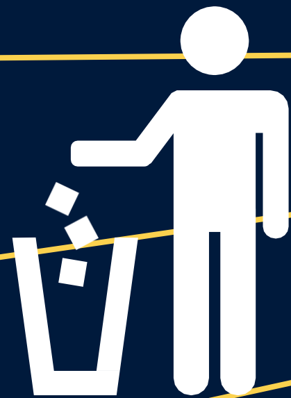
Área de Basura