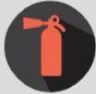
Fire fighting equipment