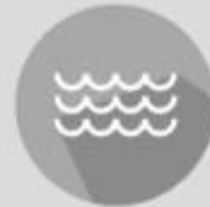
Water Treatment Plant