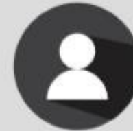
Settlement Association Parque Industrial PyME