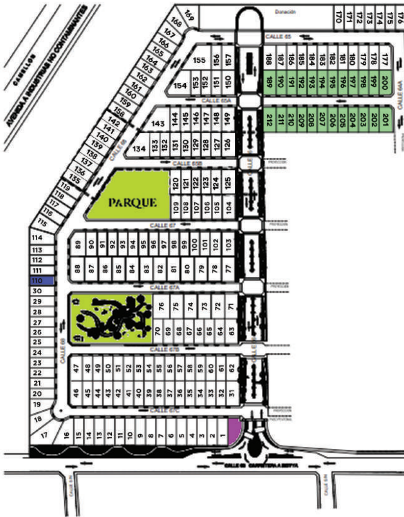
Planta de Conjunto