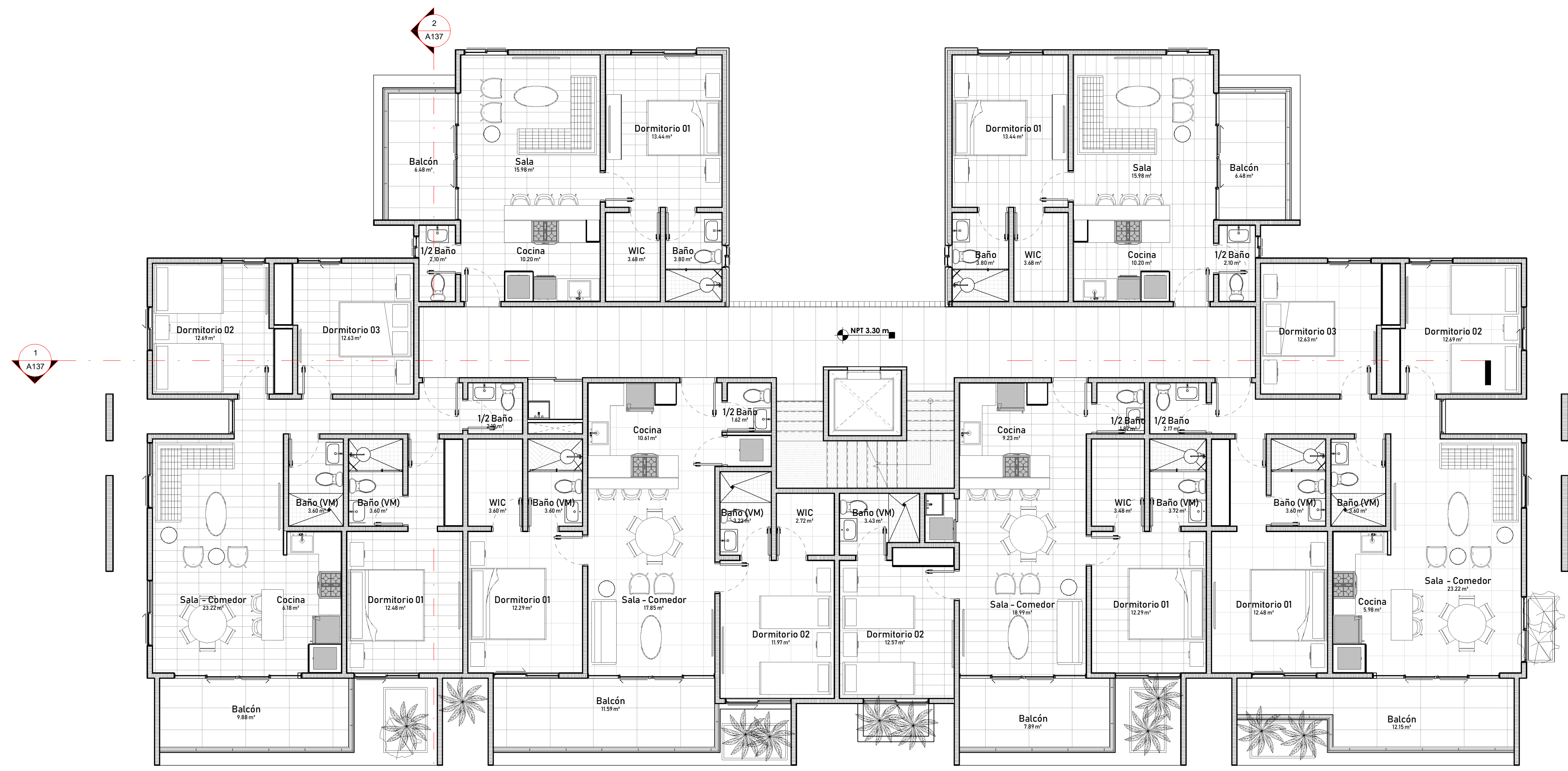
1 A128 Planta Arq. Amueblada Nivel +2 1 : 75