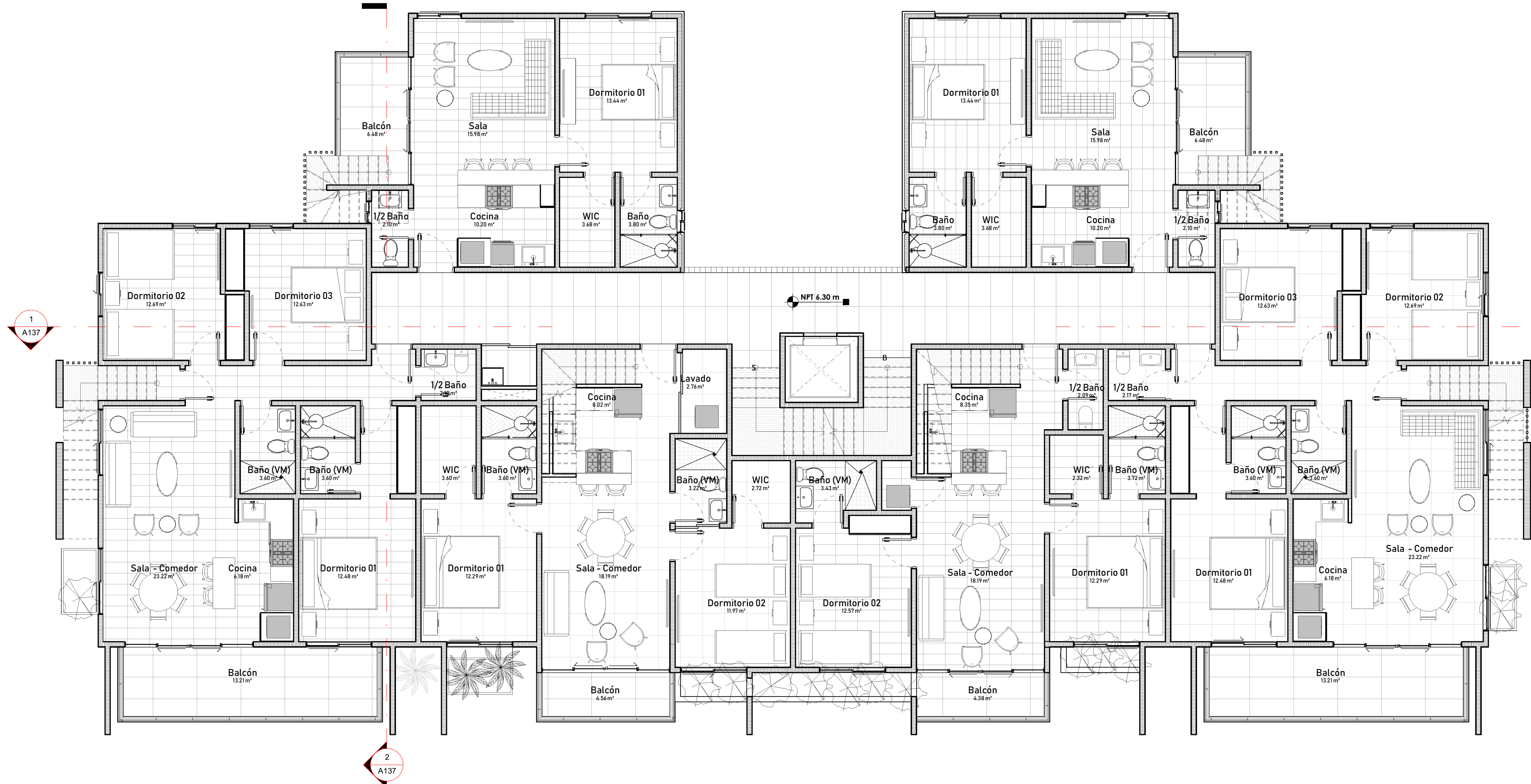
1 Planta Arq. Amueblada Nivel +3 1 : 75