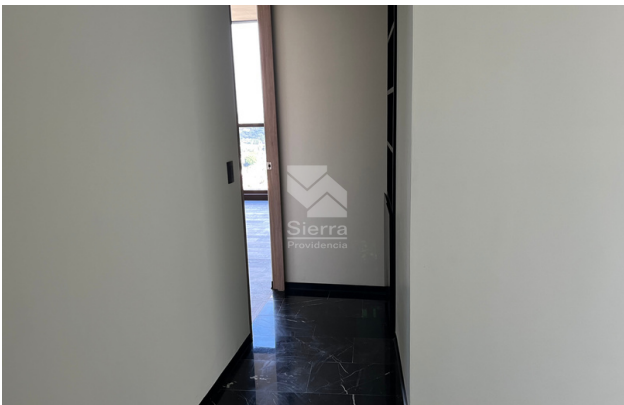
PASILLO A RECÁMARA