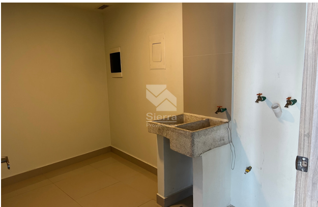
ÁREA DE LAVADO