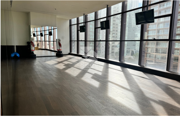
SALÓN DE YOGA