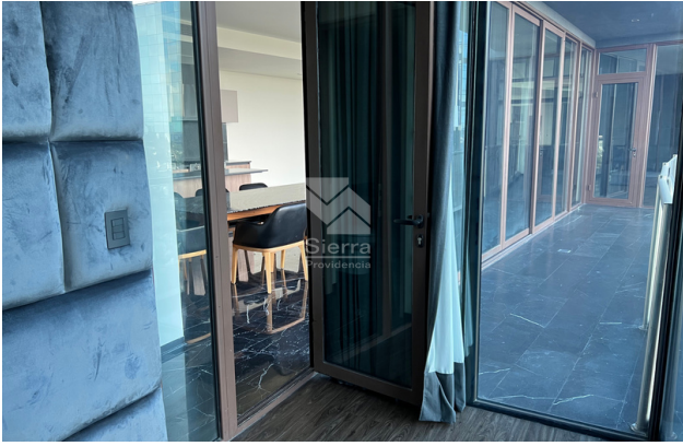
CUARTO TV/ OFICINA