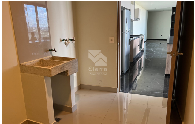
ÁREA DE LAVADO