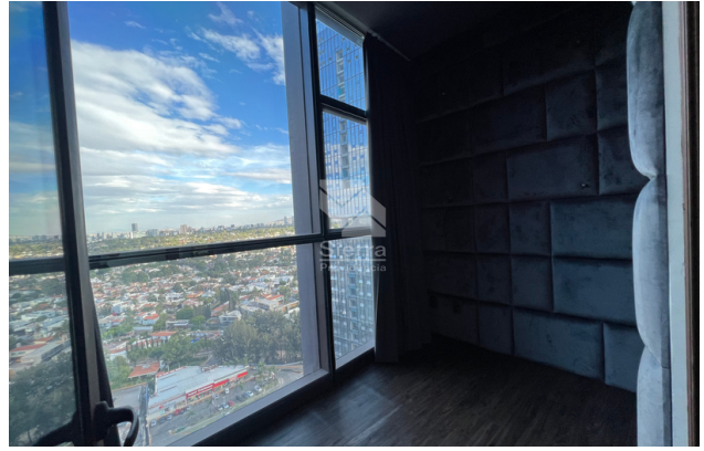
CUARTO TV/ OFICINA