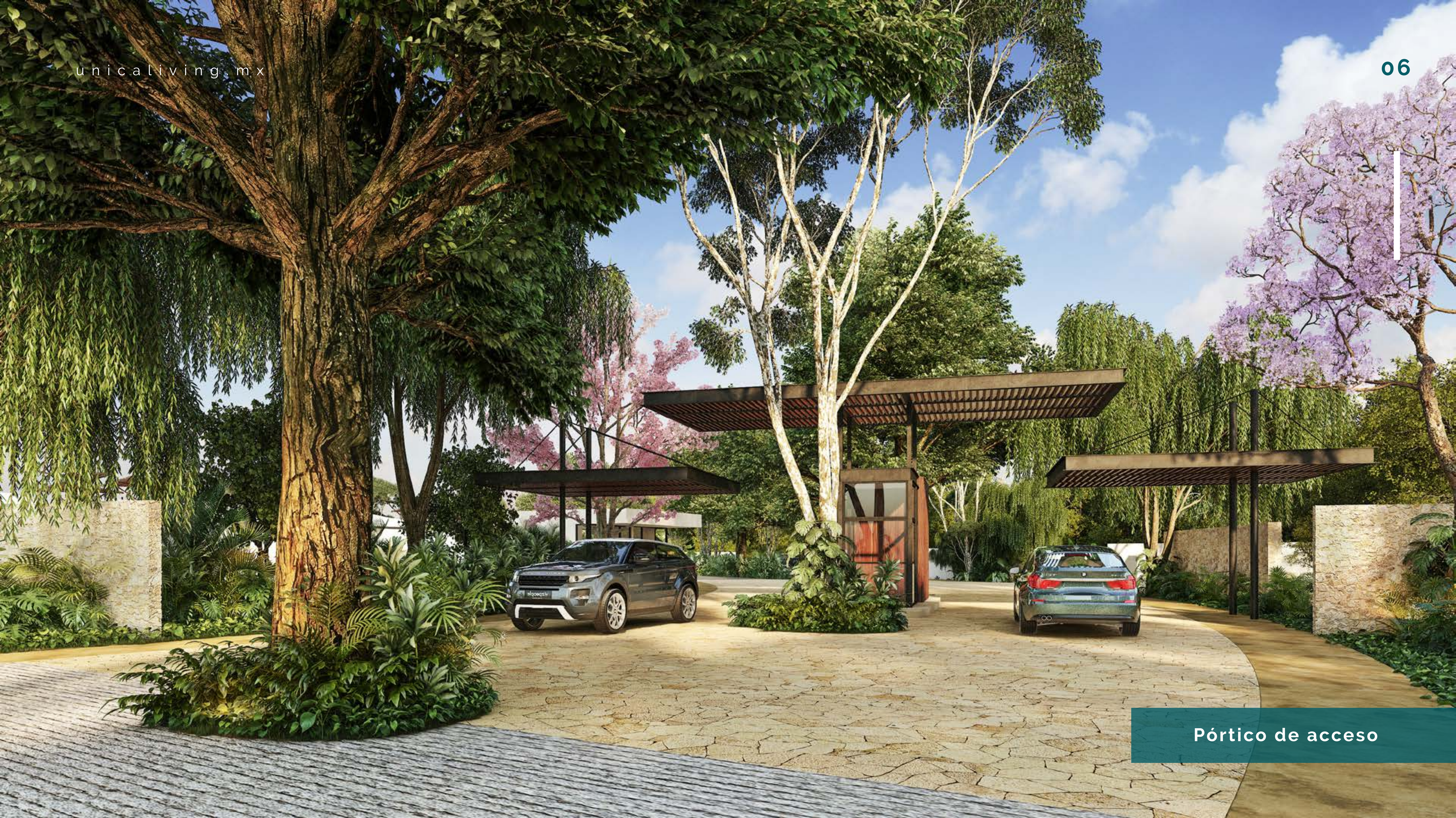
Pórtico de acceso