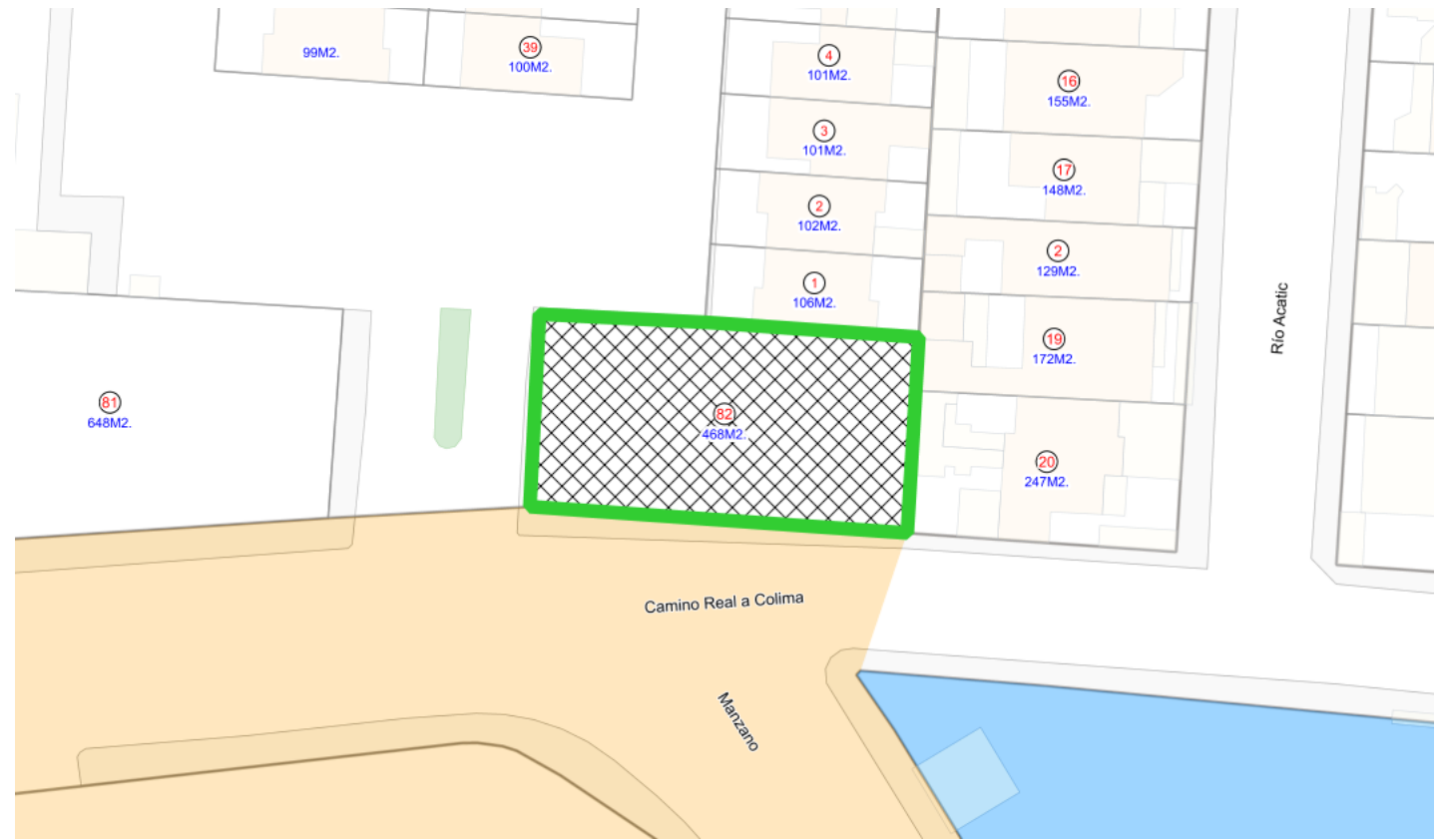
Croquis de Predio