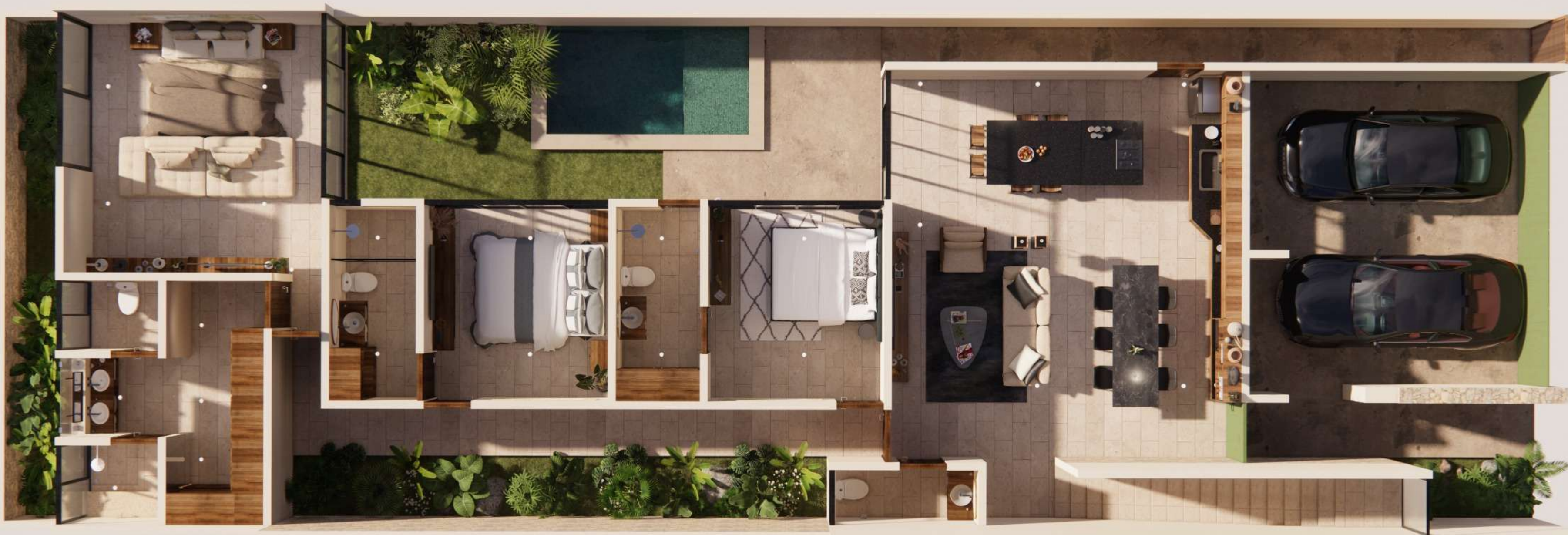
*Planta arquitectónica de Planta Baja