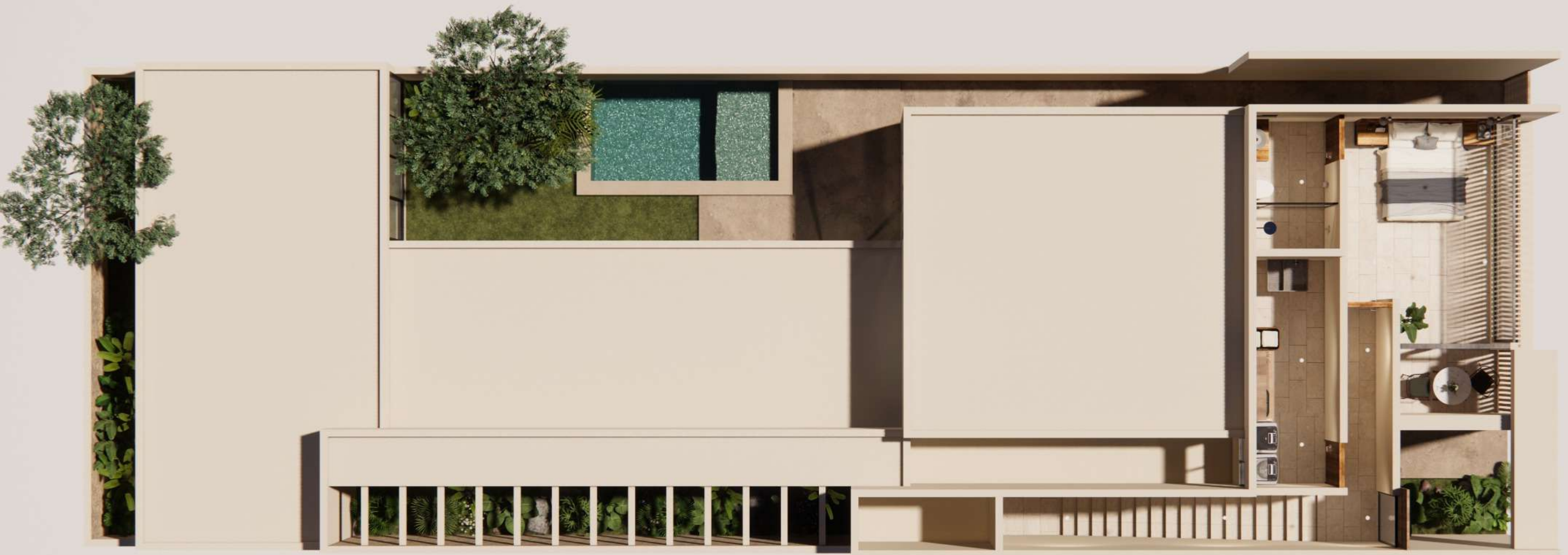
*Planta arquitectónica de Planta Baja