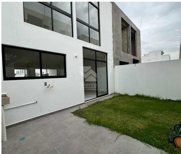
Patio / Área de lavado