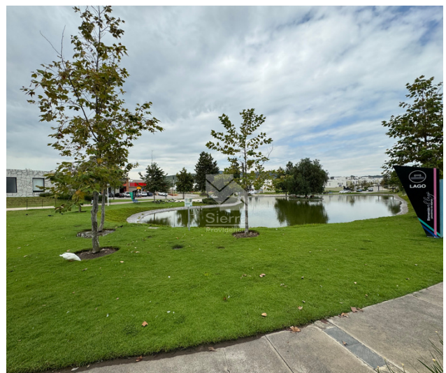
Parque con lago