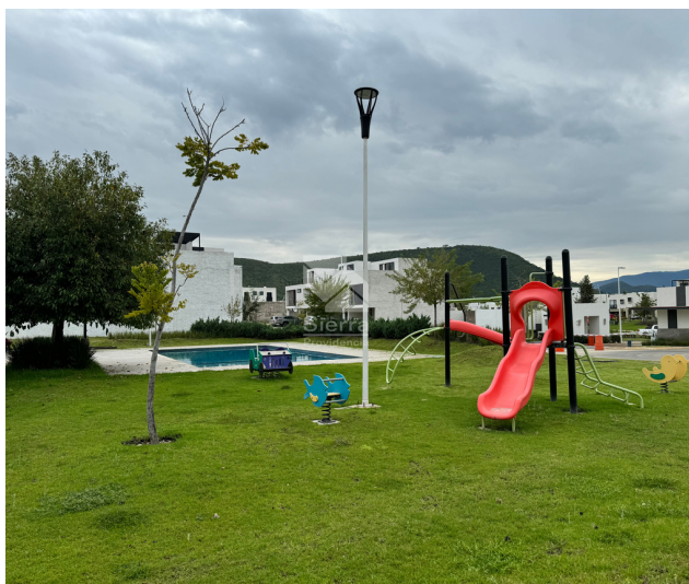
Área de juegos infantiles