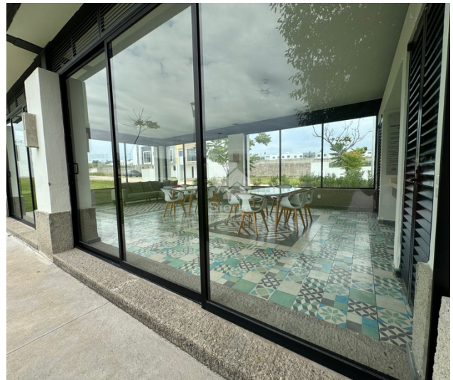
Terraza con baños