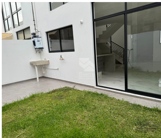
Patio / Área de lavado