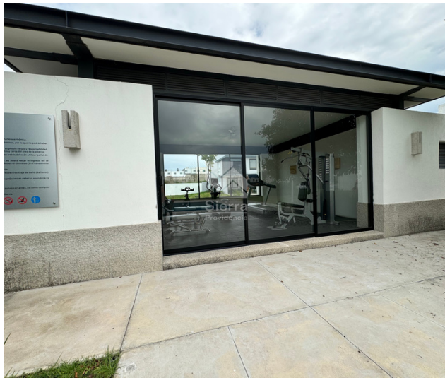
Terraza con baños