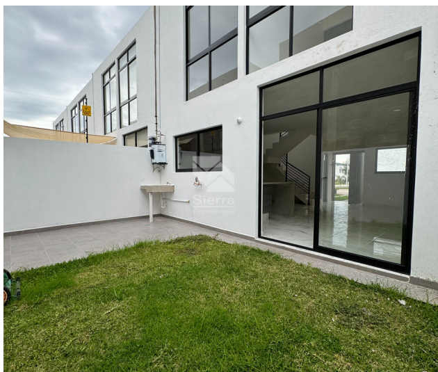
Patio / Área de lavado