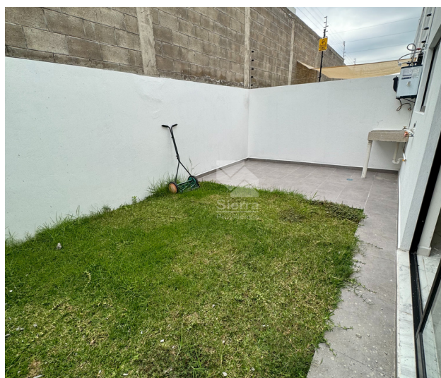
Patio / Área de lavado