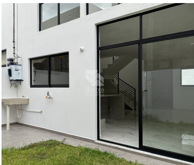
Patio / Área de lavado