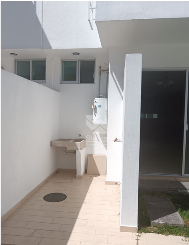
Cuarto de lavado