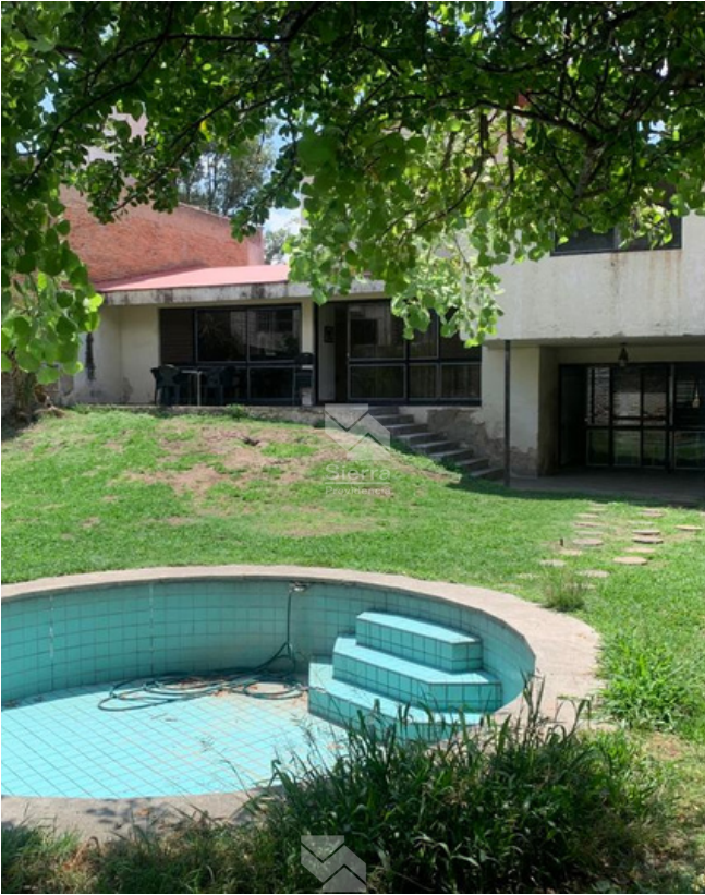
Jardín con alberca