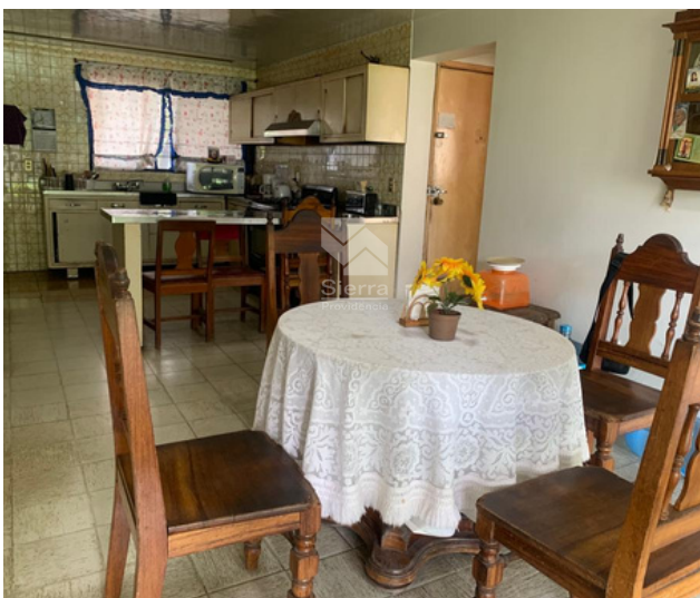
Cocina y antecomedor