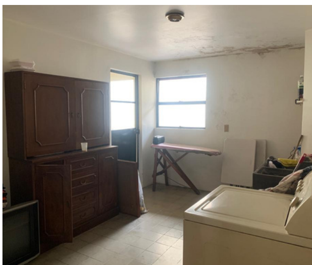
Cuarto de lavado