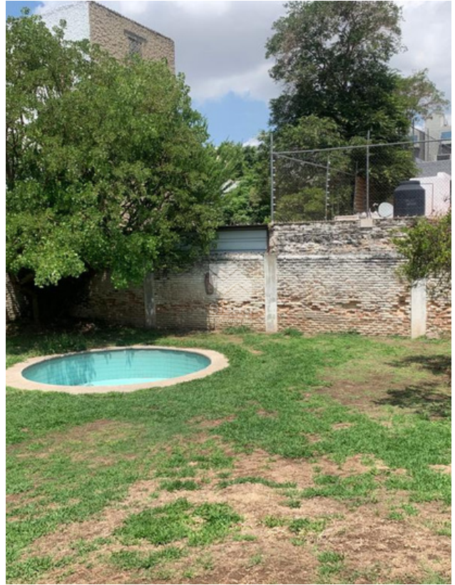
Jardín con alberca