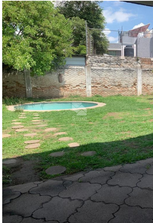
Jardín con alberca