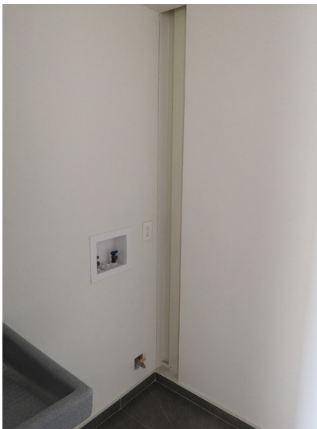
Cuarto de lavado