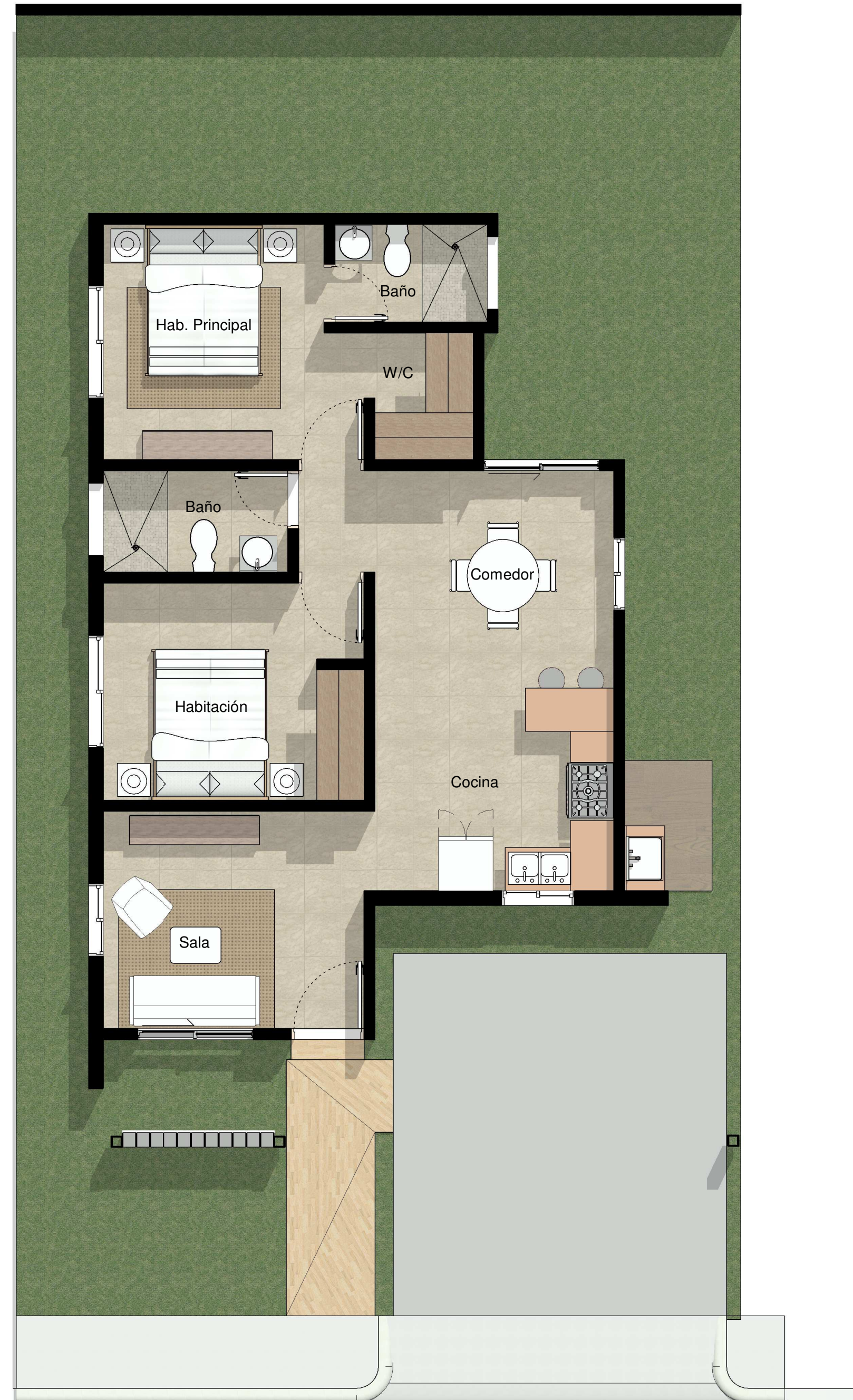
1 PLANTA ARQ. N1 1 : 50