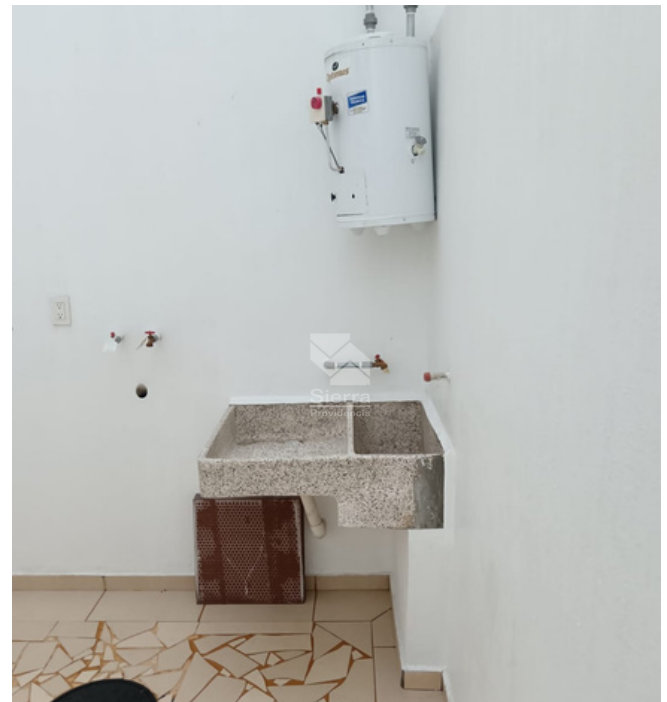
Cuarto de lavado