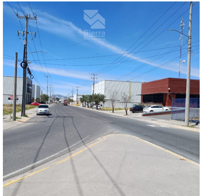
Entrada a parque