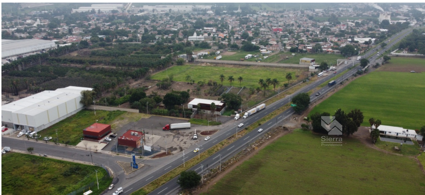
Vista área ingreso desde López Mateos