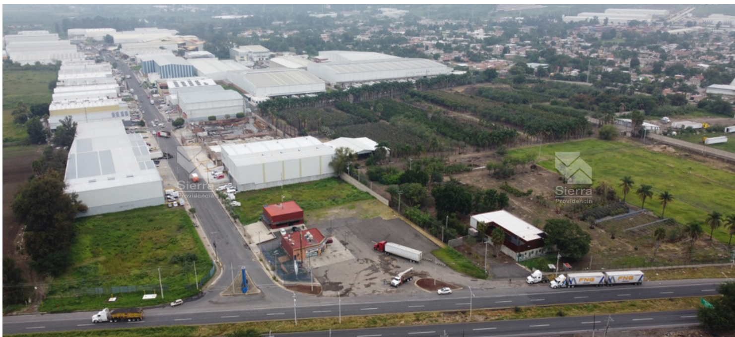
Vista área ingreso desde López Mateos