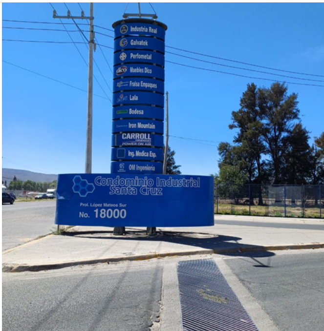
Entrada a parque