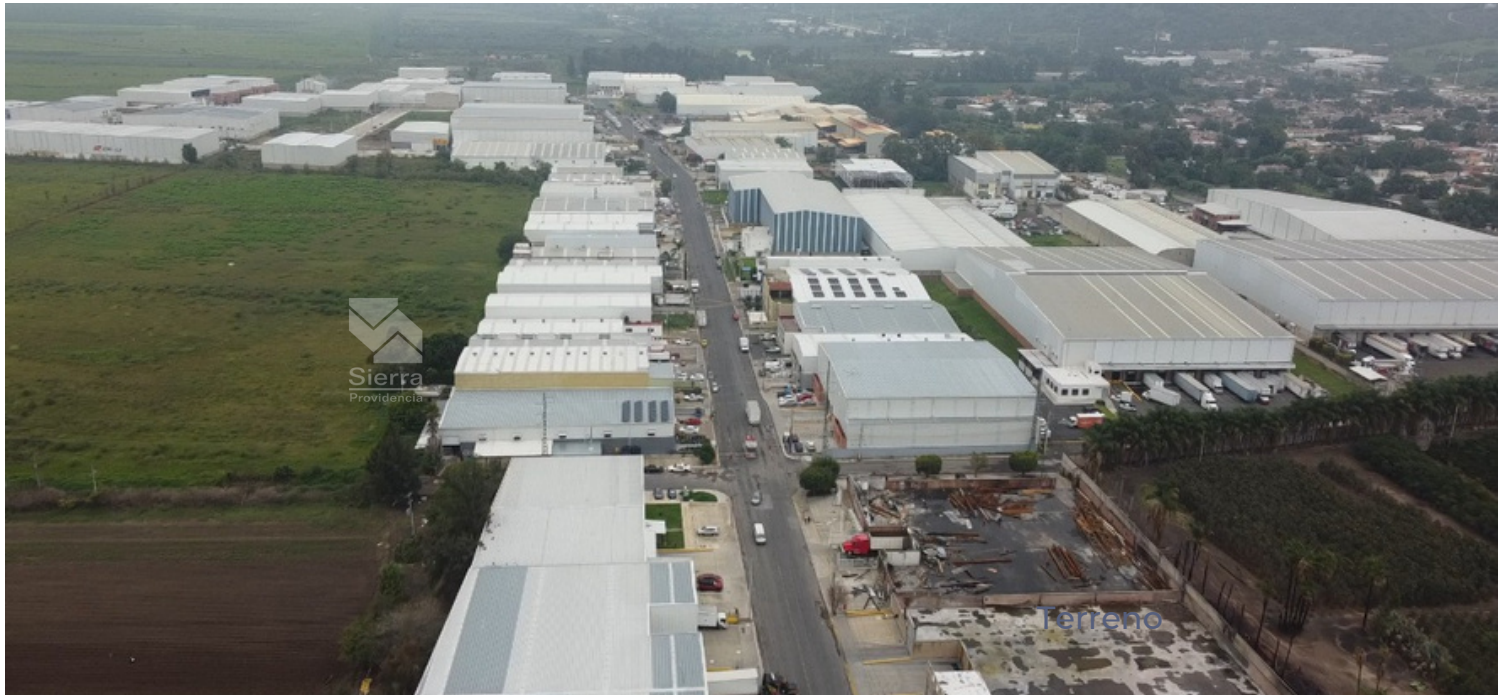
Parque consolidado, 95% construido y en operación