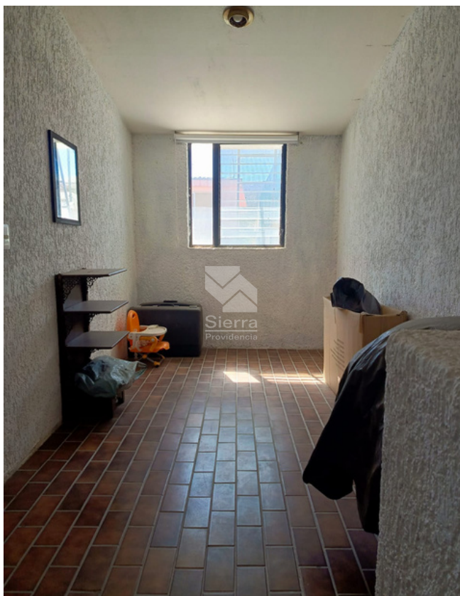
CUARTO DE SERVICIO