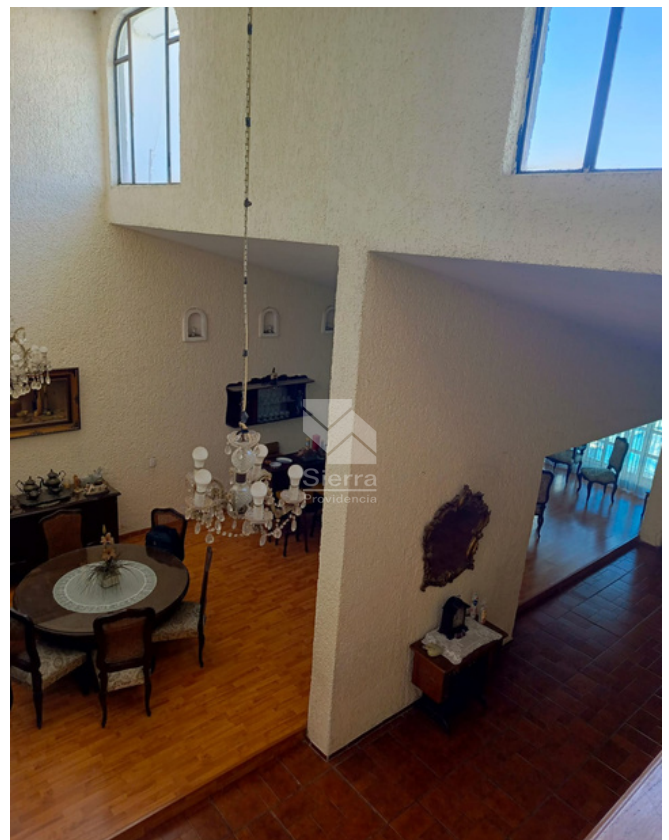
VISTA DESDE NIVEL SUPERIOR