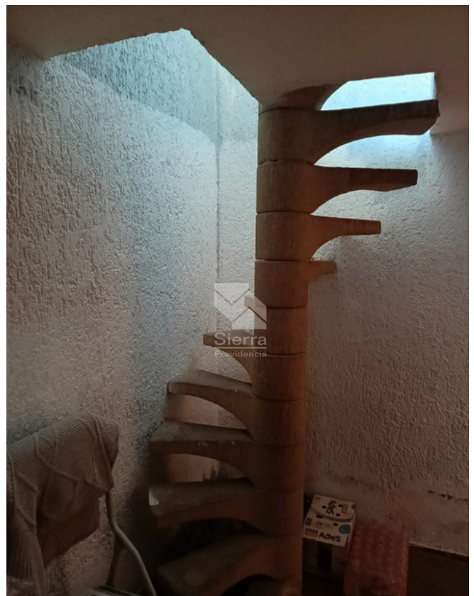
ESCALERAS DE SERVICIO