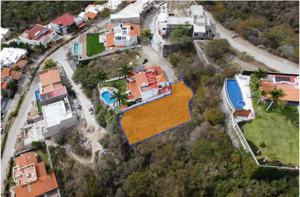
VISTA AÉREA DEL TERRENO