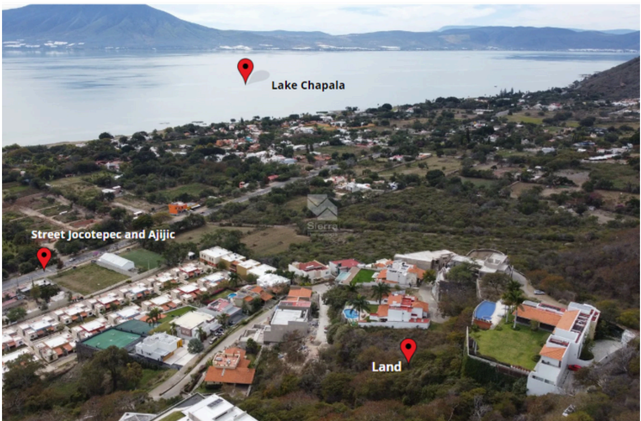
VISTA AÉREA DESDE TERRENO